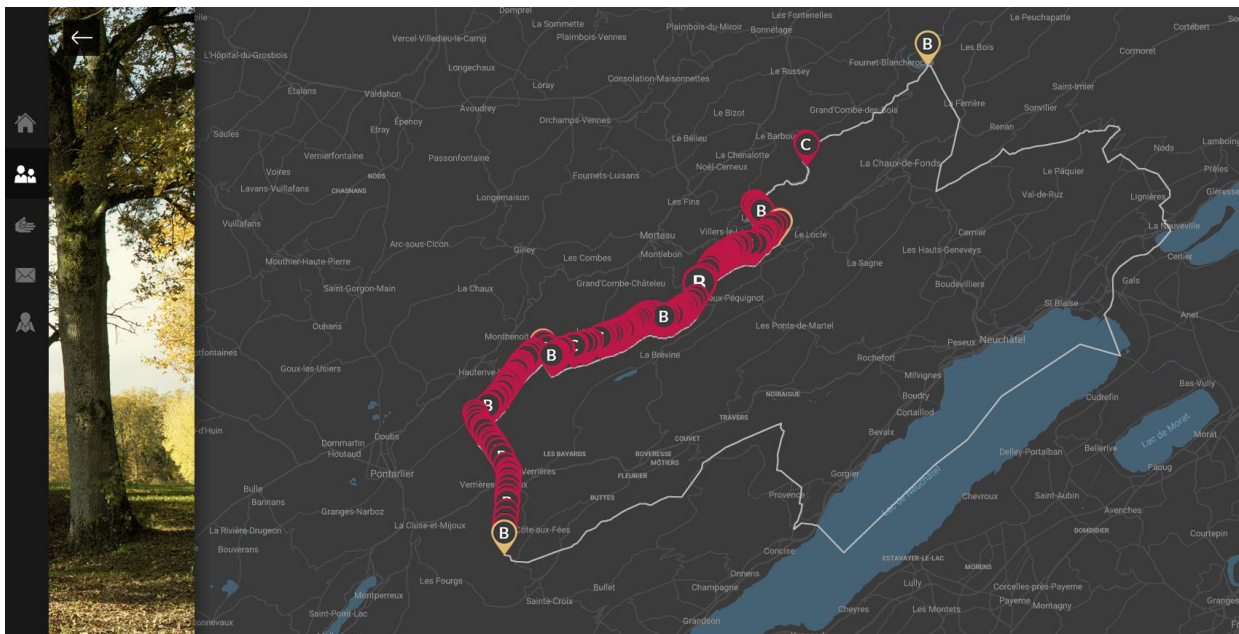
Les 201 bornes sur la frontière nationale de la République et Canton de Neuchâtel