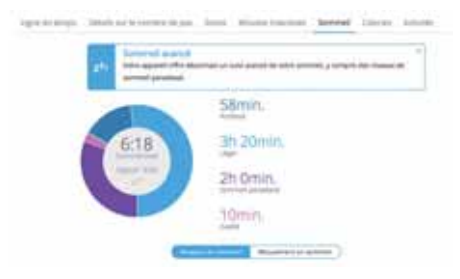
FIGURE 1 Exemple d'analyse du sommeil, Garmin Express, Garmin Forerunner 935

Les préoccupations quant à la fiabilité des informations, ainsi que les connaissances concernant la manière dont ces informations sont produites et dont devraient disposer les médecins pour pouvoir renseigner leurs patients, sont au premier plan. Il s'agit d'une part de gérer le doute par rapport à la valeur énoncée par l'outil (par exemple, la fréquence cardiaque mesurée est-elle correcte?). D'autre part, il faut être conscient que les valeurs fournies par l'appareil diffèrent dans certains cas de la définition médicale d'un paramètre physiologique. Pour des problèmes de sommeil, par exemple, les informations fournies par une montre sont extrapolées sur la base des mouvements et de la variabilité de la fréquence cardiaque. Chaque type de mesure présente donc des défis différents dans l'interprétation et dans la gestion en consultation. L'enjeu primordial pour les médecins réside dans la mise en place d'études scientifiques pour évaluer la fiabilité des informations et dans l'homologation éventuelle pour l'usage médical de certains outils. Ces préoccupations semblent partagées dans la littérature où l'on retrouve des considérations sur l'évaluation des appareils eux-mêmes et sur les interventions sur la santé médiées par ces technologies. 2-4