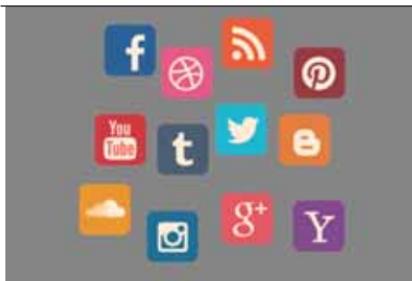
FIGURE 1 Illustration de différents types de réseaux sociaux

Au-delà de l'information, les participants ont également abordé l'aspect communautaire des forums et réseaux sociaux. Ces derniers sont perçus comme un moyen d'obtenir un soutien social via un partage d'expériences similaires et une entraide mutuelle entre plusieurs individus souffrant de la même pathologie. Les médias sociaux seraient particulièrement utiles pour les maladies orphelines et symptômes inexplicables en termes de reconnaissance sociale et reconstruction identitaire. Toutefois, le risque de s'enfermer dans une identité de malade a aussi été discuté. Il s'agirait d'éviter que ces patients deviennent des icônes de leur maladie via une surexposition sur les réseaux sociaux, d'où l'intérêt de travailler avec eux de manière individualisée pour qu'ils n'existent pas seulement au travers de leur maladie. Quelles seraient par exemple