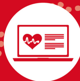
MA SANTÉ CONNECTÉE