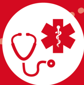
MÉDECINE DE PREMIER RECOURS