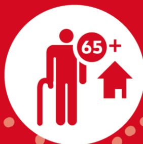
SÉJOURS ET SOINS DES ÂÎNÉS