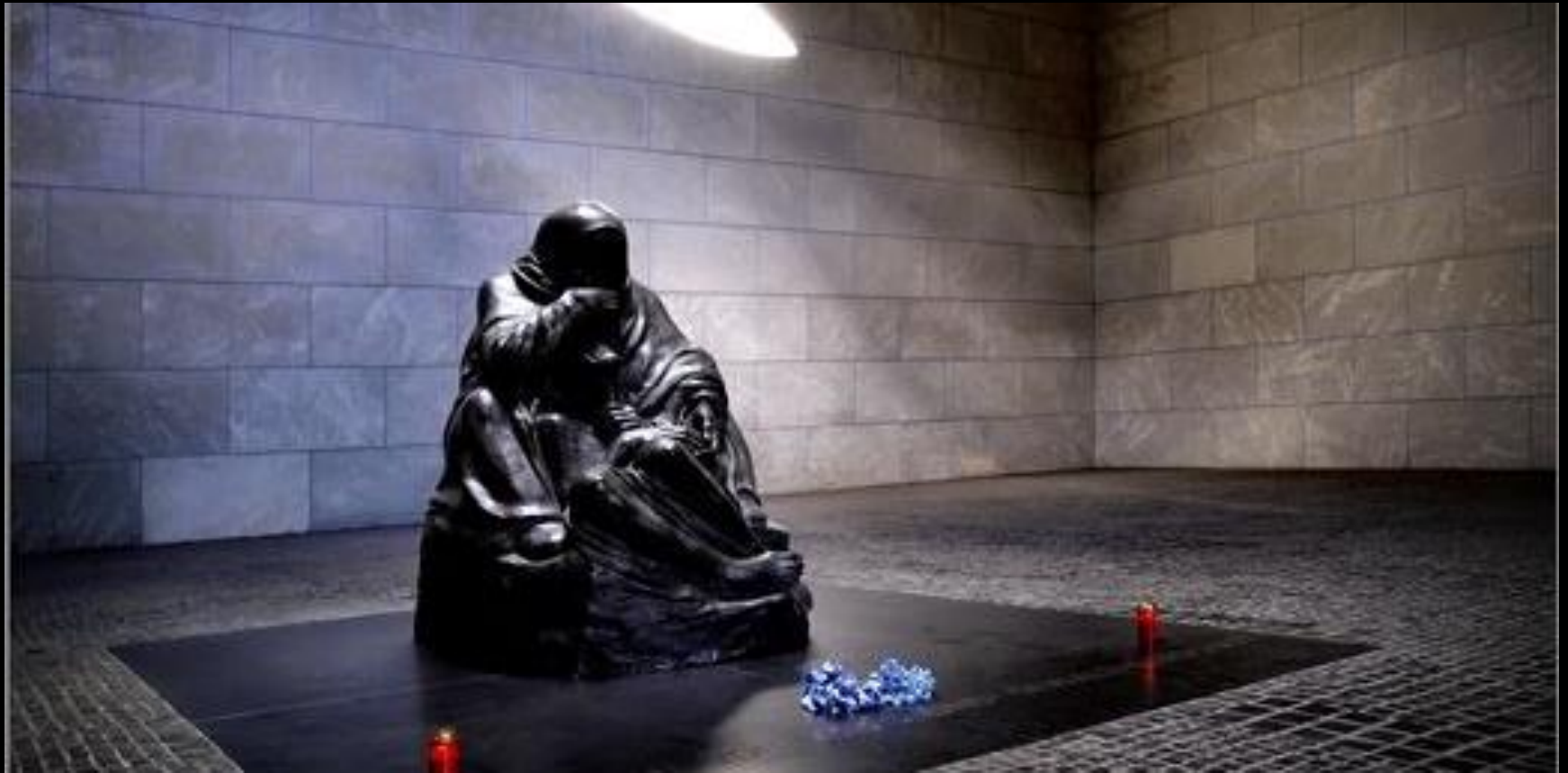
Berlin, Tombeau du soldat inconnu