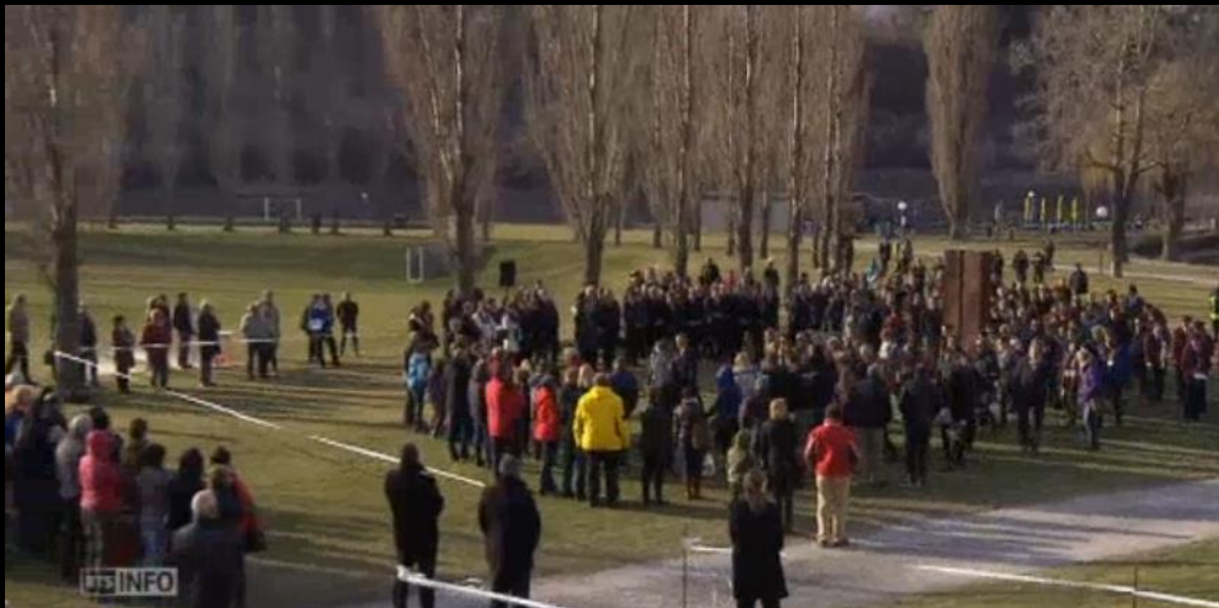
Accident de Sierre, 2012