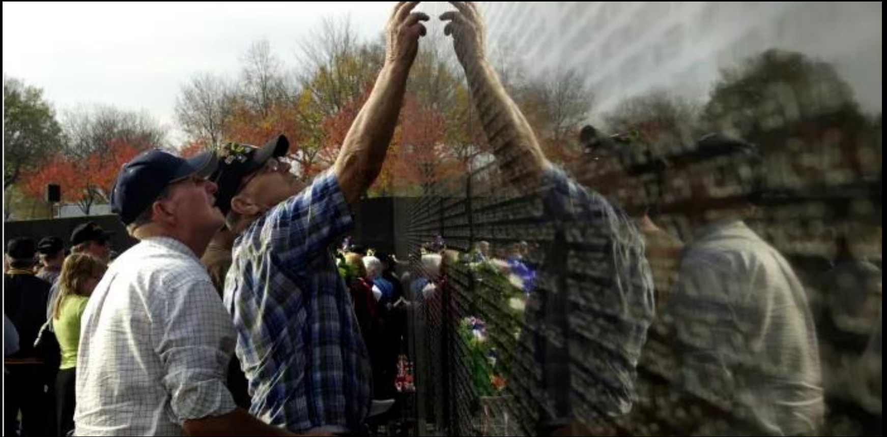
Mémorial en honneur des soldats américains morts au Vietnam