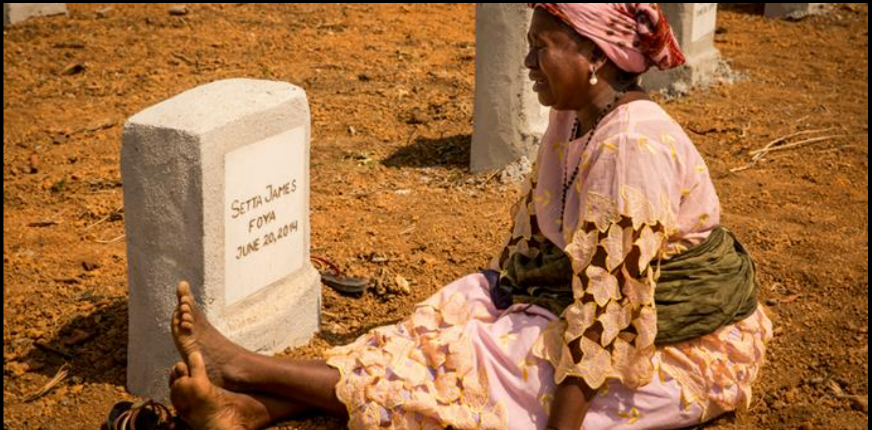
Cimetière pour les victimes d’Ebola, Liberia