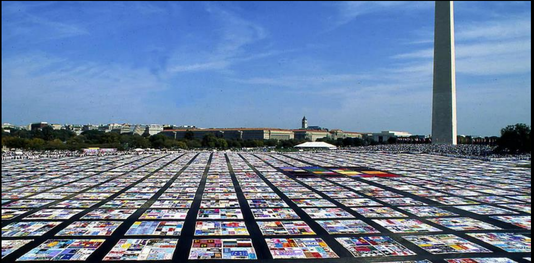
Courtepointe géante en mémoire des victimes du SIDA