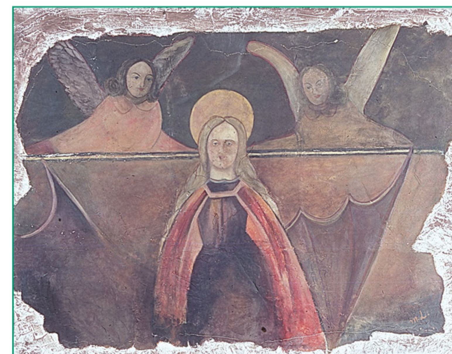
Retirés du mur, les fragments de peinture du 15 e siècle sont ensuite appliqués sur un nouveau support à base de gypse, avant d'être fortement surpeints. [OPAN, 1978]