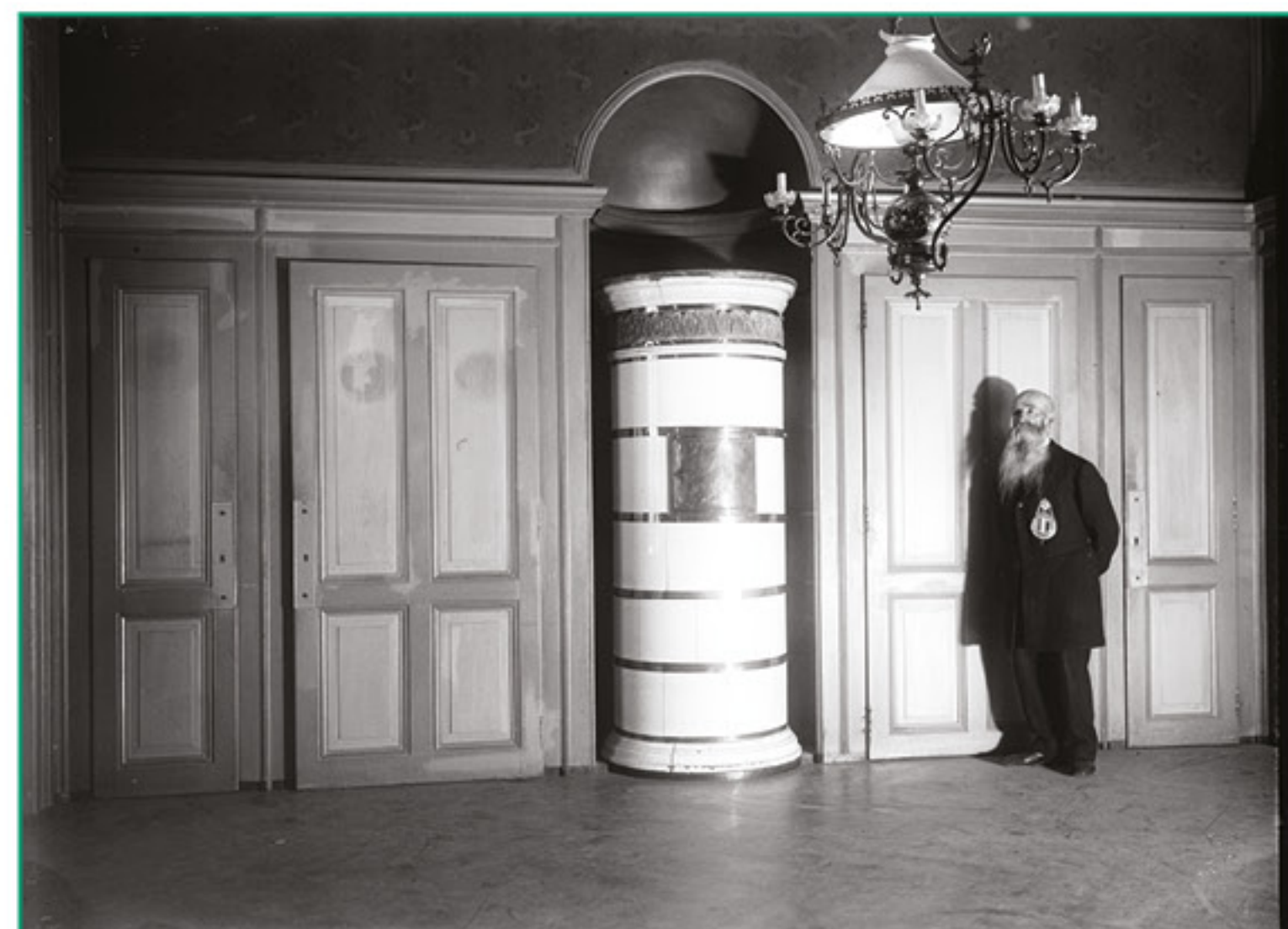
Subdivisée en plusieurs petites pièces, la salle Marie de Savoie a servi de logement à partir de 1848, l'huissier étant le dernier locataire en 1909.

Lors de la découverte des peintures en 1911, cinq à six couches de badigeon recouvraient les fragments peints, rappelant que la pièce avait progressivement perdu son éclat initial au profit de fonctions utilitaires, comme celles de cuisine du gouverneur au 18 e siècle ou d'appartement du président du Conseil d'État en 1848.