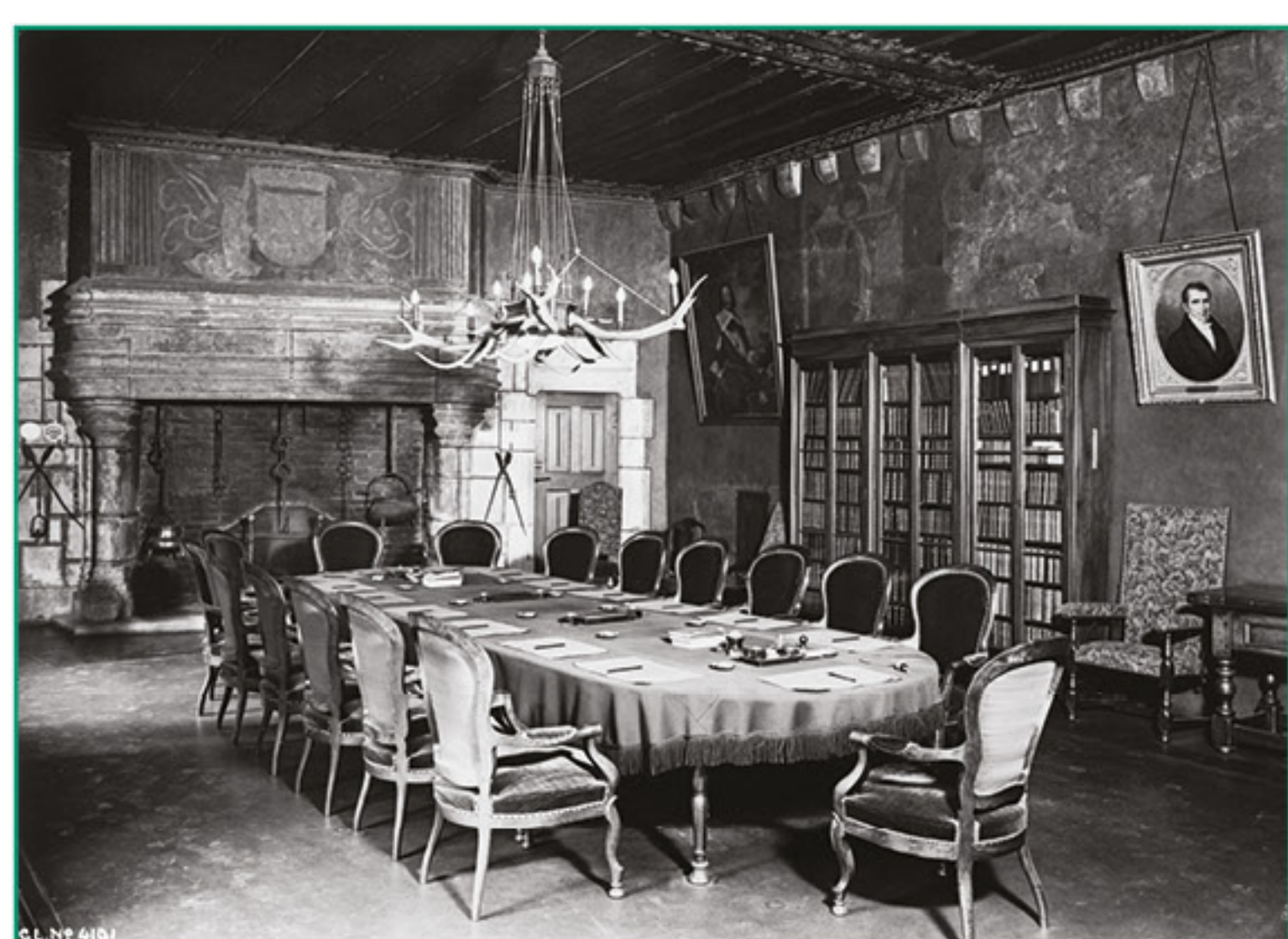
Au terme de la restauration du début du 20 e siècle, la salle retrouve son volume, sa cheminée, ainsi qu'une partie de son décor d'origine. L'agencement en salle des commissions hésite entre une ambiance néo-médiévale et la réponse aux besoins contemporains de l'administration. [OPAN fonds ISCP n°4192, photo Ernest Sauser, 1933]