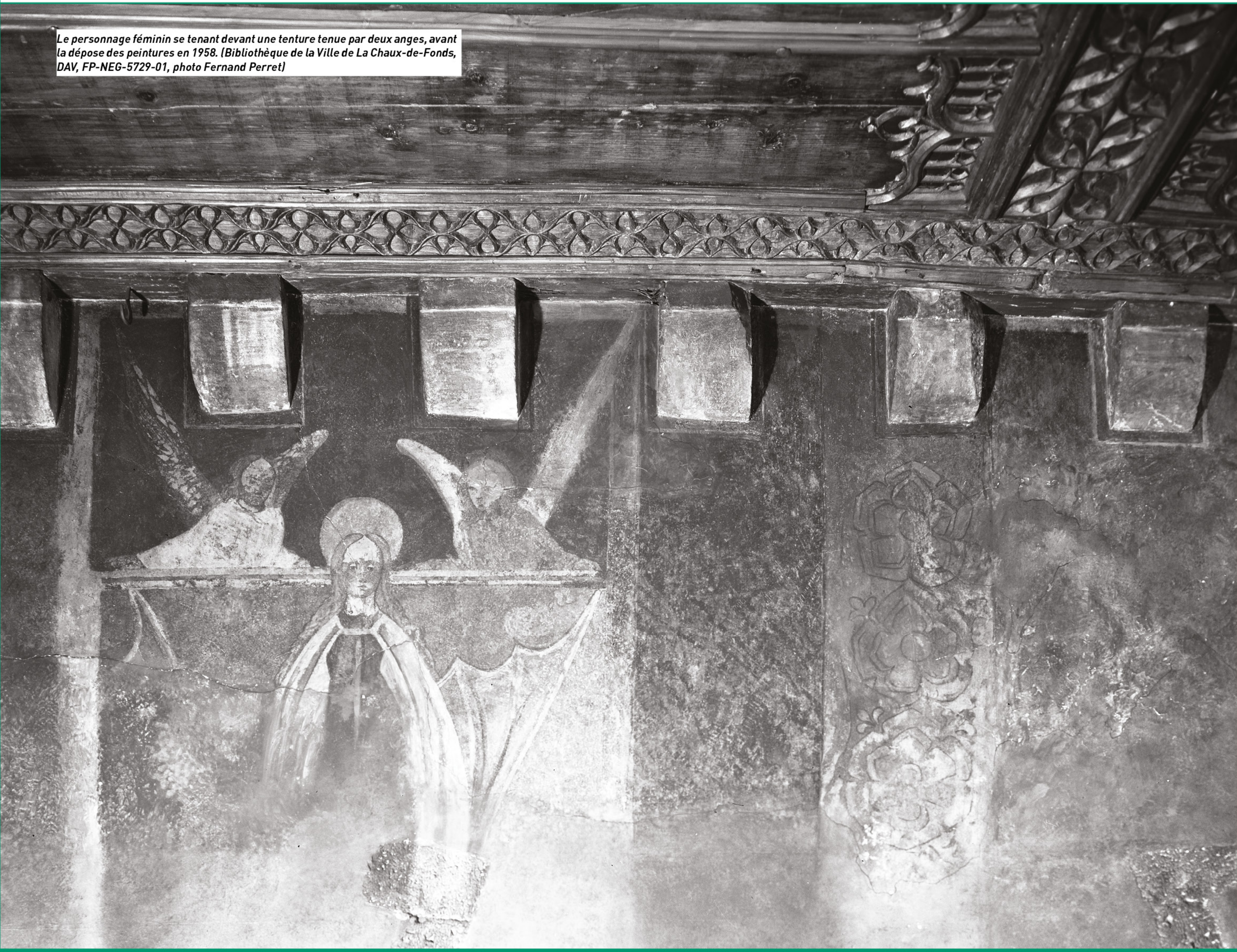
Le personnage féminin se tenant devant une tenture tenue par deux anges, avant la dépose des peintures en 1958.