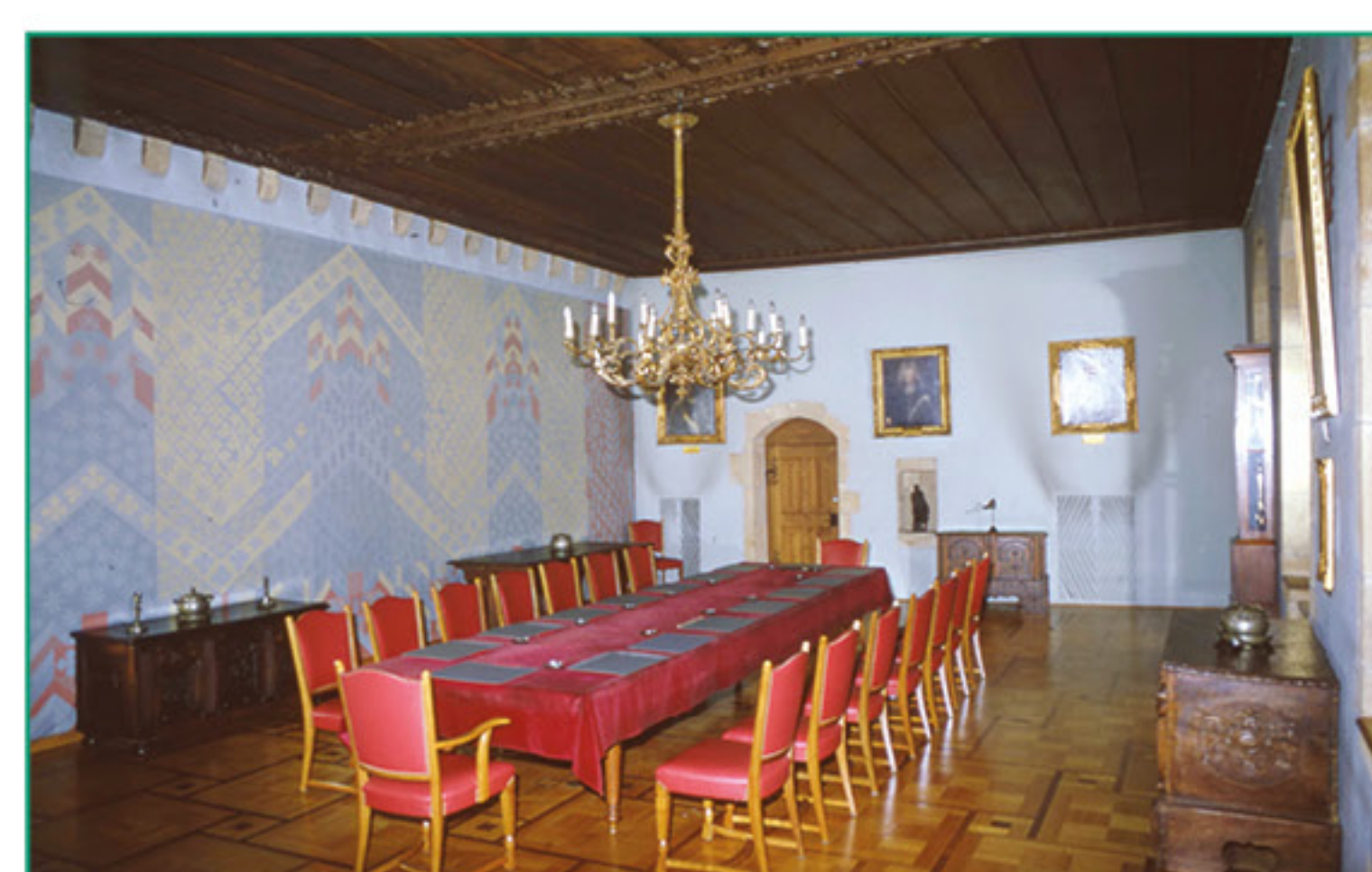
En 1958, le mur nord est doublé et la salle ornée d'un décor géométrique aux couleurs pastel qui n'épargne que le manteau de la cheminée. [OPAN, 1978]