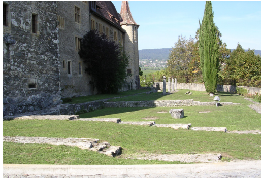
Château de Colombier. L'exceptionnelle interaction entre le château médiéval et les vestiges de l'ancienne villa gallo-romaine est une des meilleures cartes de visite du site.

Le Pays des Trois-Lacs à l'époque romaine