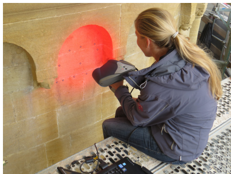
Collégiale de Neuchâtel, relevé laserométrique d'une marque lapidaire (archéo développement S.à.r.l. - Cortaillod)

A la collégiale de Neuchâtel, l'accent a été mis sur l'étude archéologique des élévations de l'église. Le relevé au pierre-à-pierre de l'ensemble du bâtiment et l'inventaire systématique des traces du chantier médiéval aident quotidiennement à orienter les choix de restauration et contribuent aussi à la récolte de données historiques de premier ordre, permettant de plonger dans la réalité technologique et sociale de la fin du 12 e siècle.