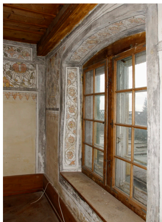
Cormondrèche, Maison Marthe. La transformation de la maison de maître en une maison de rapport à plusieurs logements a permis de documenter et de préserver divers décors du 17 e au 19 e siècle, dont ces peintures du 17 e siècle.