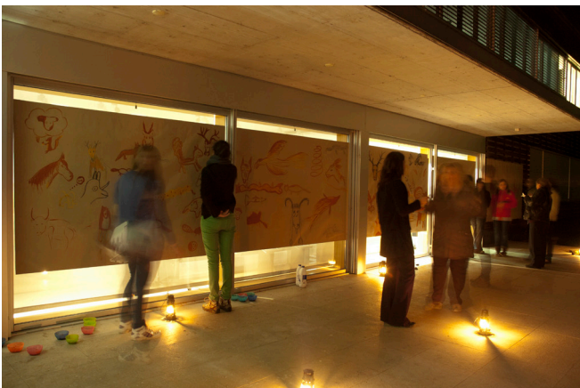
Après leurs expériences de transe chamanique, les visiteurs peignent leur animal-totem sur une longue fresque participative à l'entrée du musée.