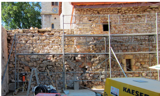
Môtiers, ancien prieuré St-Pierre. Mise au jour des maçonneries romanes (11 e -12 e siècles) lors de la restauration de la façade.

Enfin, à Môtiers, la réfection de la façade sud de l'ancienne église Saint-Pierre a permis de nouvelles observations archéologiques, en particulier en ce qui concerne le bas-côté sud construit au 11 e -12 e siècle et remanié vers 1528. Dans la cour du prieuré, ce sont les restes de bâtiments conventuels antérieurs à l'an mil et d'époque romane qui ont été mis en évidence, avec des sépultures.