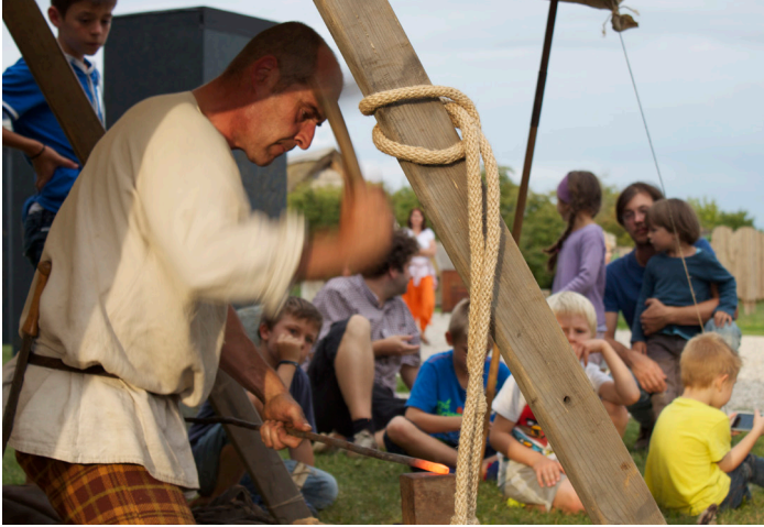
«Feu et lumière» : au son du marteau, le forgeron bat le fer pour produire des répliques d'objets celtiques.

• Le lendemain dimanche 19 mai 2013, pour la Journée internationale des musées, le public a pu prolonger l'expérience par des ateliers de peinture sur papyrus et des visites commentées de l'exposition.