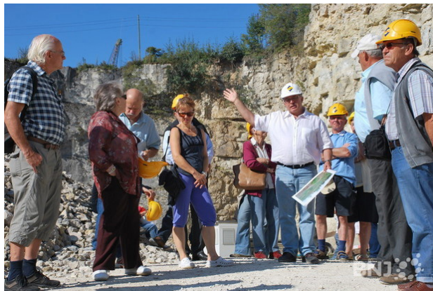
Visite des carrières en activité de La Cernia (Neuchâtel) dans le cadre des Journées européennes du patrimoine.

En 2012, la 19 e édition des Journées européennes du patrimoine a attiré quelque 2400 visiteurs les 8 et 9 septembre sur le thème «Pierre et béton». Le patrimoine neuchâtelois s'est décliné sous de multiples formes à Neuchâtel (carrière de La Cernia, tour des prisons, anciennes prisons), à La Chaux-de-Fonds (Synagogue, Musée d'histoire, Musée international de l'horlogerie, anciennes carrières), à Noiraigue (ouvrages militaires) et à Hauterive (Laténium, ancienne carrière).