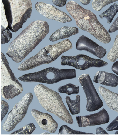
Saint-Blaise/Bains des Dames 5

Haches et haches-marteaux en roches tenaces De l'utilitaire à l'affichage social au Néolithique final