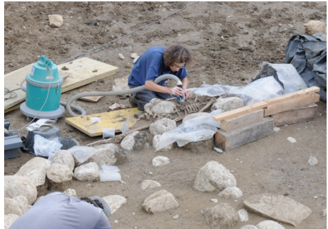
Colombier/Plantées de Rive. Tumulus de l'âge du Bronze moyen ; à droite, dégagement du squelette de la tombe centrale.