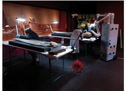
Traitements de conservation-restauration sur la collection d'antiquités égyptiennes du Musée d'ethnographie de Neuchâtel: dépoussiérage par aspiration, repositionnement de fragments désolidarisés du visage de la momie et infiltration d'un consolidant suite au soulèvement de la couche picturale des sarcophages.