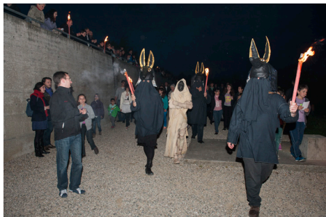
Escortée par quatre Anubis porteurs de flambeaux, la momie Nakht-ta-Netjeret quitte le musée pour rejoindre la barque funéraire qui l'emportera dans l'au-delà...

• «Nuit d'Anubis»: le 18 mai 2013, pour accompagner l'ouverture de l'exposition «Fleurs des pharaons», la Nuit des musées s'est placée sous le signe du maître des nécropoles de l'Égypte antique. Plus d'un millier de visiteurs ont participé à des ateliers créatifs, assisté à des démonstrations et des lectures de contes sur le thème des parfums, des onguents végétaux, des divinités et des rituels du temps des pharaons. Clou de la soirée et fascination garantie, en particulier pour les enfants: la résurrection de la momie Nakht-ta-Netjeret, sa procession à la lueur des torches, en musique, à travers le parc du musée, puis son dernier voyage vers l'au-delà, à bord d'une barque funéraire voguant sur les flots sombres de l'étang du Laténium. Ce riche programme, qui a exigé une mobilisation massive des employé-e-s du musée, a bénéficié de la collaboration de plusieurs partenaires: Rouge Vernis Make-up, Marie Lourizi, l'ensemble musical Shams et le café-restaurant l'Ami-Ami.