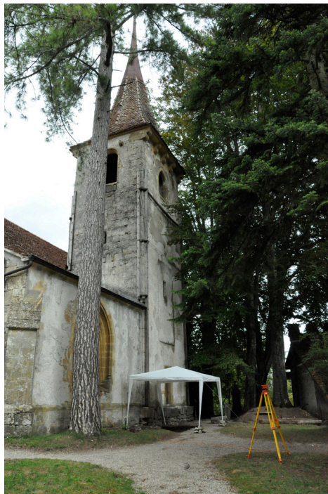
Cressier, ancienne église St-Martin. Le clocher (11 e s.), en partie bâti à partir de matériaux gallo-romains, laissait soupçonner une occupation culturelle romaine et haut-médiévale du site, qui commence à être révélée par la fouille archéologique.

Dans le domaine de l'architecture civile, les immeubles Charles-Knapp 31 et 33 à Neuchâtel ont fait l'objet d'une analyse archéologique au cours de leur transformation; celle-ci a révélé les phases architecturales successives depuis le 17 e siècle de ces anciens bâtiments ruraux transformés en résidence vers 1800. A Môtiers, l'étude des trois bâtiments contigus abritant aujourd'hui le musée Rousseau, le musée régional du Val-de-Travers et le théâtre des Mascarons a permis quant à elle de restituer l'état de l'îlot au moment où Jean-Jacques Rousseau y séjournait, ainsi que de reconnaître les vestiges d'une vaste maison villageoise de la fin du 15 e siècle. A Hauterive, la maison de maître du domaine de Champréveyres a fait l'objet d'investigations ayant révélé ses états successifs depuis le 16 e siècle, tandis qu'à Cormondrèche, l'étude archéologique de la Maison Marthe, Grand-Rue 56, a permis de reconnaître les traces de bâtiments du 16 e siècle et surtout d'étudier de manière détaillée l'architecture et les décors peints de la vaste maison construite dans la première moitié du 17 e siècle et complétée d'une aile basse vers 1705.