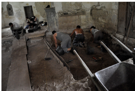
Cressier, ancienne église St-Martin. Etudiants au travail durant les premiers jours de la fouille-école organisée conjointement par l'OPAN, l'UNINE et l'UNIL.

A la rue des Moulins 15 à Neuchâtel, c'est un remarquable plafond peint du 17 e siècle, révélé par des travaux de transformations, qui a été étudié.