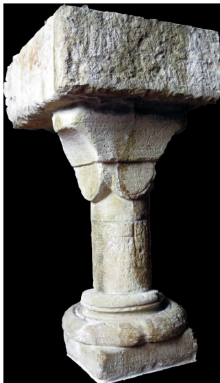
Ancienne abbaye prémontrée de Fontaine-André, colonnette de l'ancien cloître roman (12 e s.)