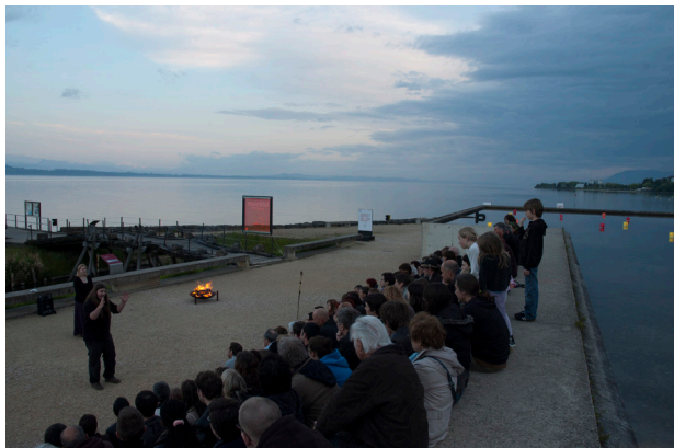
Représentation de contes médiévaux à la nuit tombante, au pied de l'étang surélevé du parc archéologique.

• Partenaire officiel du Festival La Tène (du 31 août au 2 septembre 2012), le Laténium s'est associé au Troglo, Centre d'animation socioculturelle, et à CeltaGora, l'association des étudiants en archéologie de l'Université de Neuchâtel, pour la conception du «Village des p'tits Celtes» et son encadrement par plus d'une douzaine d'animateurs. Parallèlement à la lecture de contes celtiques, enfants et parents ont pu s'exercer à la confection de figurines en terre cuite ainsi qu'à la fabrication de parures (fibules, médaillons et bandeaux de cuir) et à la peinture de motifs celtiques.