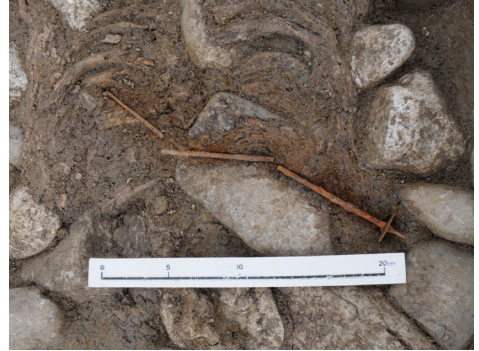
Colombier/Plantées de Rive. Tombe à inhumation du Bronze moyen; à droite, détail d'une épingle en bronze à tête discoïdale pointue.

Séparée de la précédente par une dalle de schiste posée de chant, la seconde sépulture est une incinération dont la datation reste à préciser (Bronze récent ?). Les os, souvent partiellement brûlés, sont disposés en petites concentrations mêlées, voire recouvertes d'un amas de pierres majoritairement altérées sous l'action du feu.