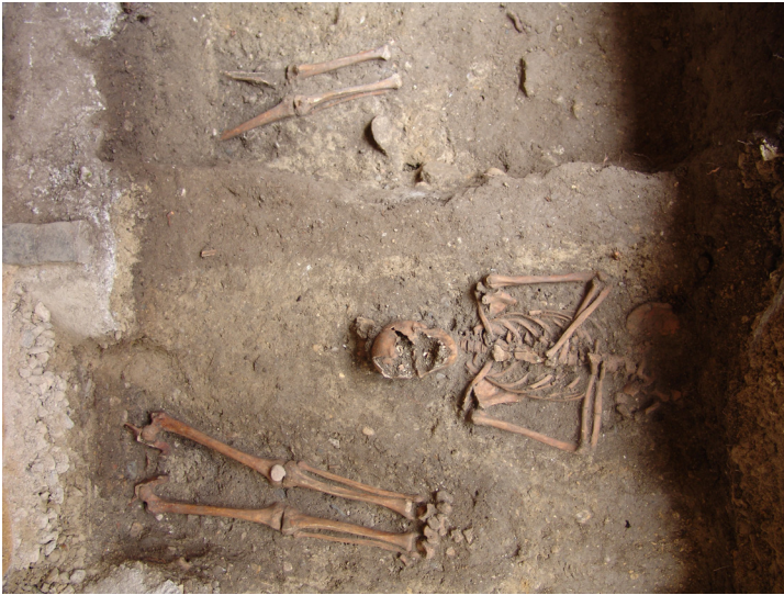
Collégiale de Neuchâtel, sépultures gothiques mises au jour dans le préau du cloître (13 e -15 e s.).

Ce travail minutieux comprend entre autres la documentation de multiples indices, qui vont des points de fixation des échafaudages médiévaux aux marques lapidaire — indications de montage ou «marques de tâcherons» —, en passant par les caractéristiques techniques des décors sculptés et les traces laissées par les outils des tailleurs de pierre. Au-delà de la compréhension des aspects successifs de l'église au Moyen Age, il devient ainsi possible d'identifier, assise après assise, les phases et accidents du chantier médiéval, les projets et hésitations des concepteurs, les outils utilisés, mais aussi le nombre et éventuellement l'origine des tailleurs employés, l'identification d'ouvriers spécialisés, la vitesse de progression du chantier et donc l'importance des moyens engagés, l'appartenance culturelle des sculpteurs, les capacités techniques des charpentiers ou les liens avec des chantiers contemporains de part et d'autre du Jura.