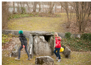
Lundi de Pâques, dix heures tapantes: départ de la «Course aux os» dans le parc du Laténium.

• En raison du succès de l'édition précédente, une nouvelle Course aux os a été organisée le lundi de Pâques 1 er avril 2013 dans le parc du Laténium.