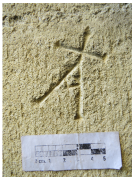
Collégiale de Neuchâtel, marque lapidaire formant la lettre A surmontée d'une croix (12 e s.).