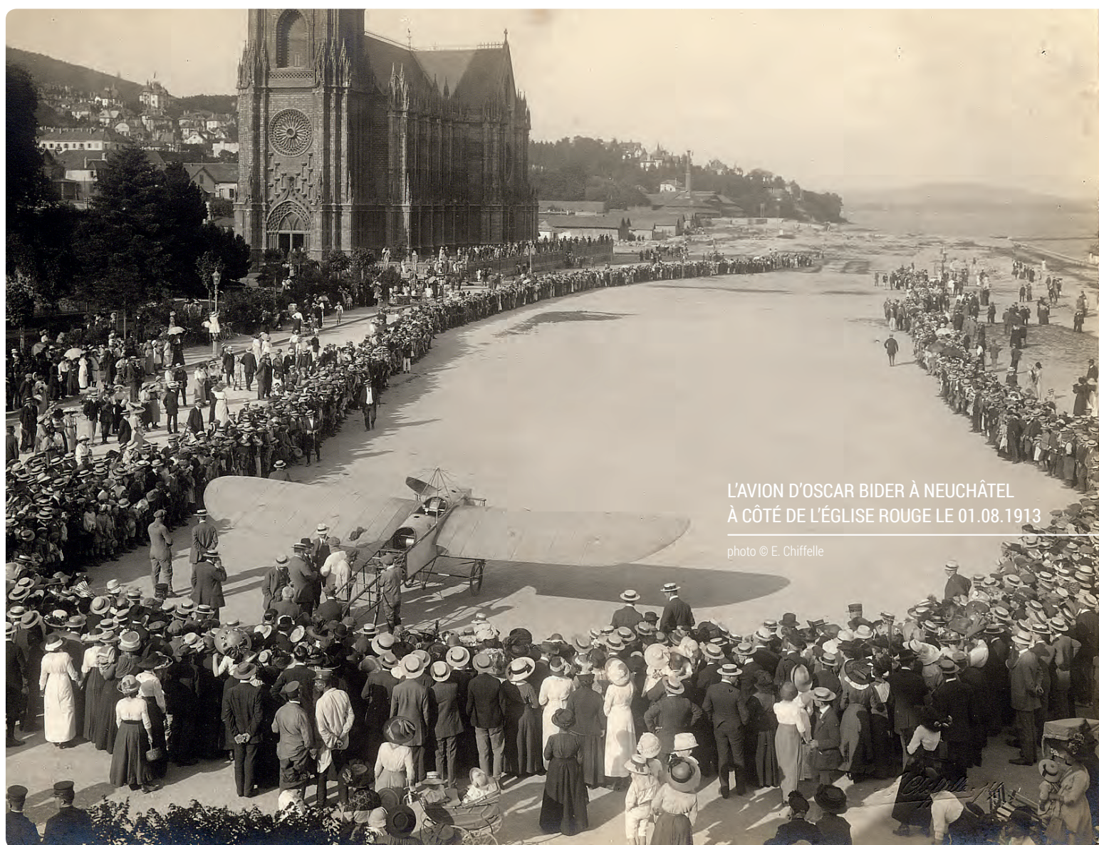
L'AVION D'OSCAR BIDER À NEUCHÂTEL À CÔTÉ DE L'ÉGLISE ROUGE LE 01.08.1913