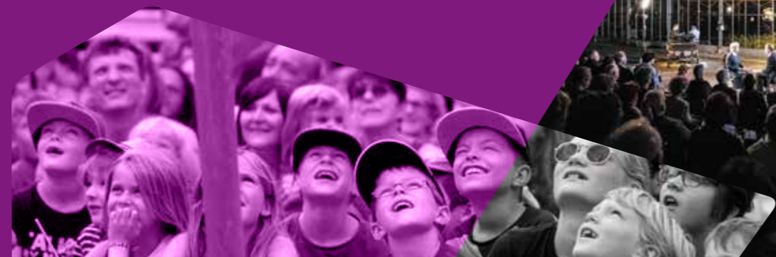
POÉSIE EN ARROSOIR

Dans le prolongement de ces débats, le rapport du Conseil d'État devrait pouvoir être présenté au Grand Conseil à l'automne 2018.