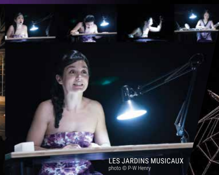
LES JARDINS MUSICAUX