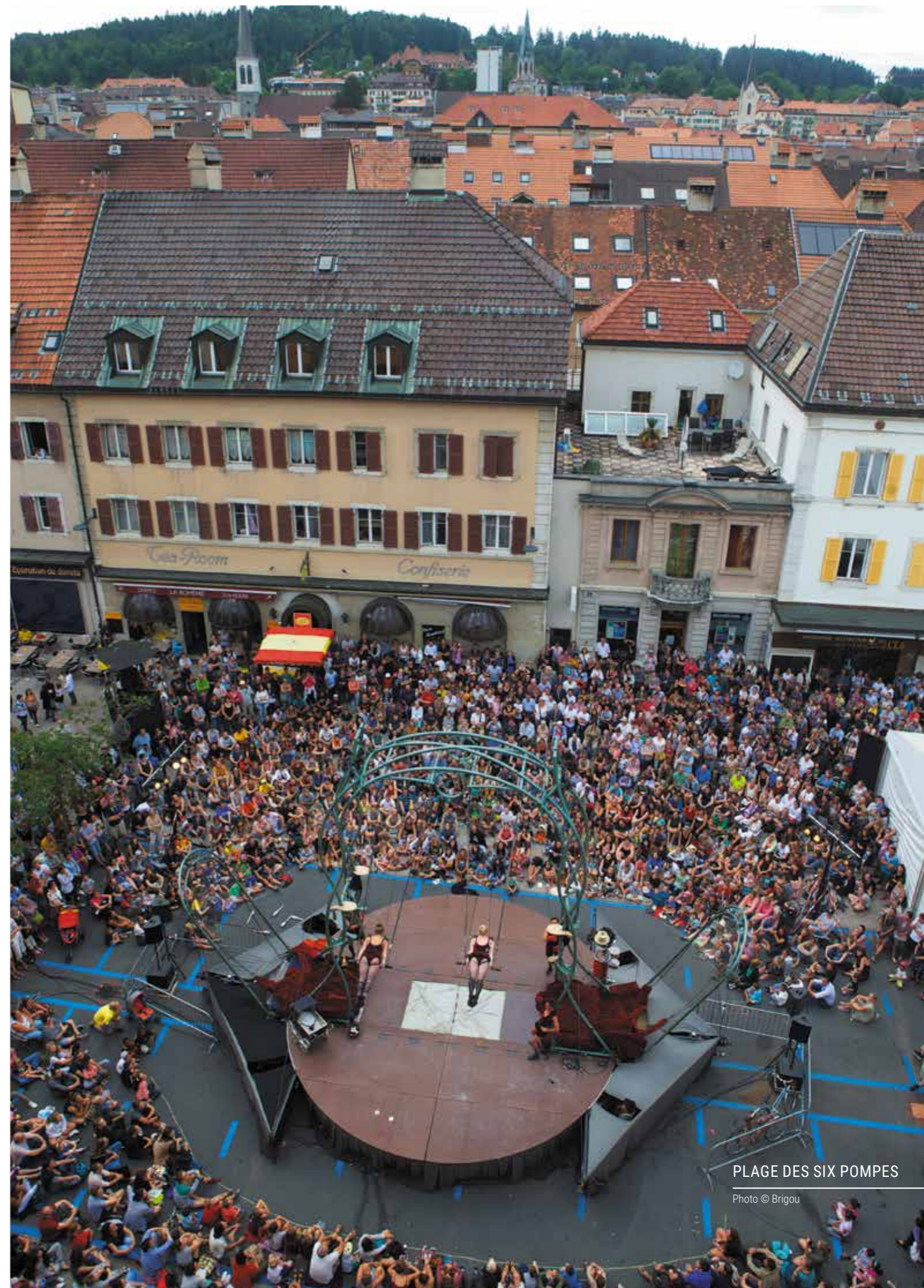
PLAGE DES SIX POMPES

TOTAL POUR ENCOURAGEMENT DES ACTIVITÉS CULTURELLES 4'385'455