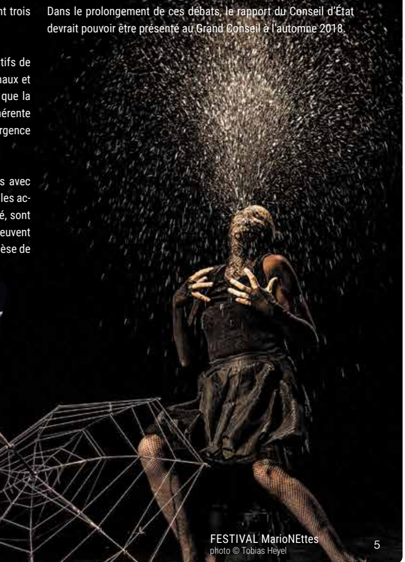
FESTIVAL MarioNettes