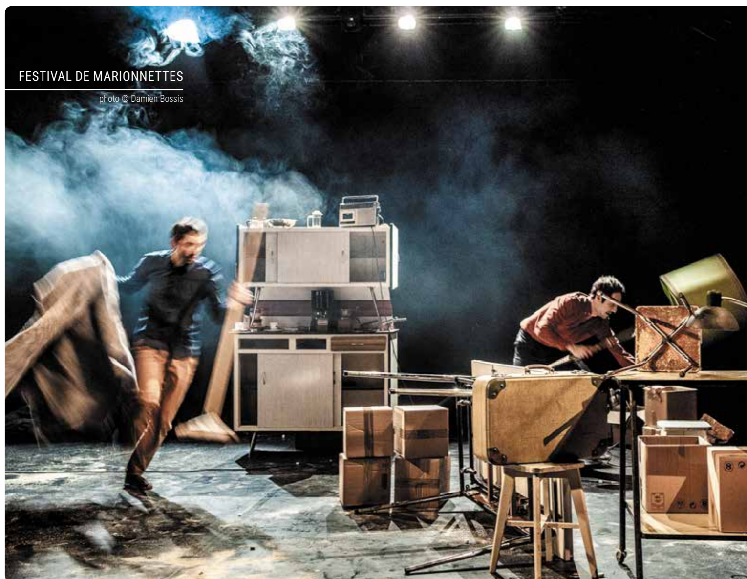
FESTIVAL DE MARIONNETTES