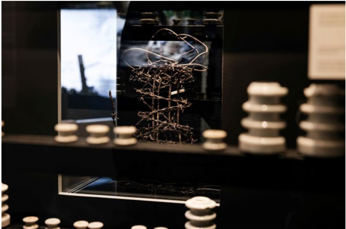
Laténium