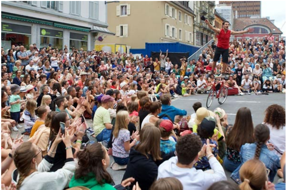
La Plage des Six Pompes 2022

La Chaux-de-Fonds, ville candidate pour devenir la première Capitale Culturelle Suisse en 2027, vient de franchir une étape importante. Le Jury national mis en place par l'Association du même nom s'est réuni le 2 mai dernier dans la Métropole horlogère.