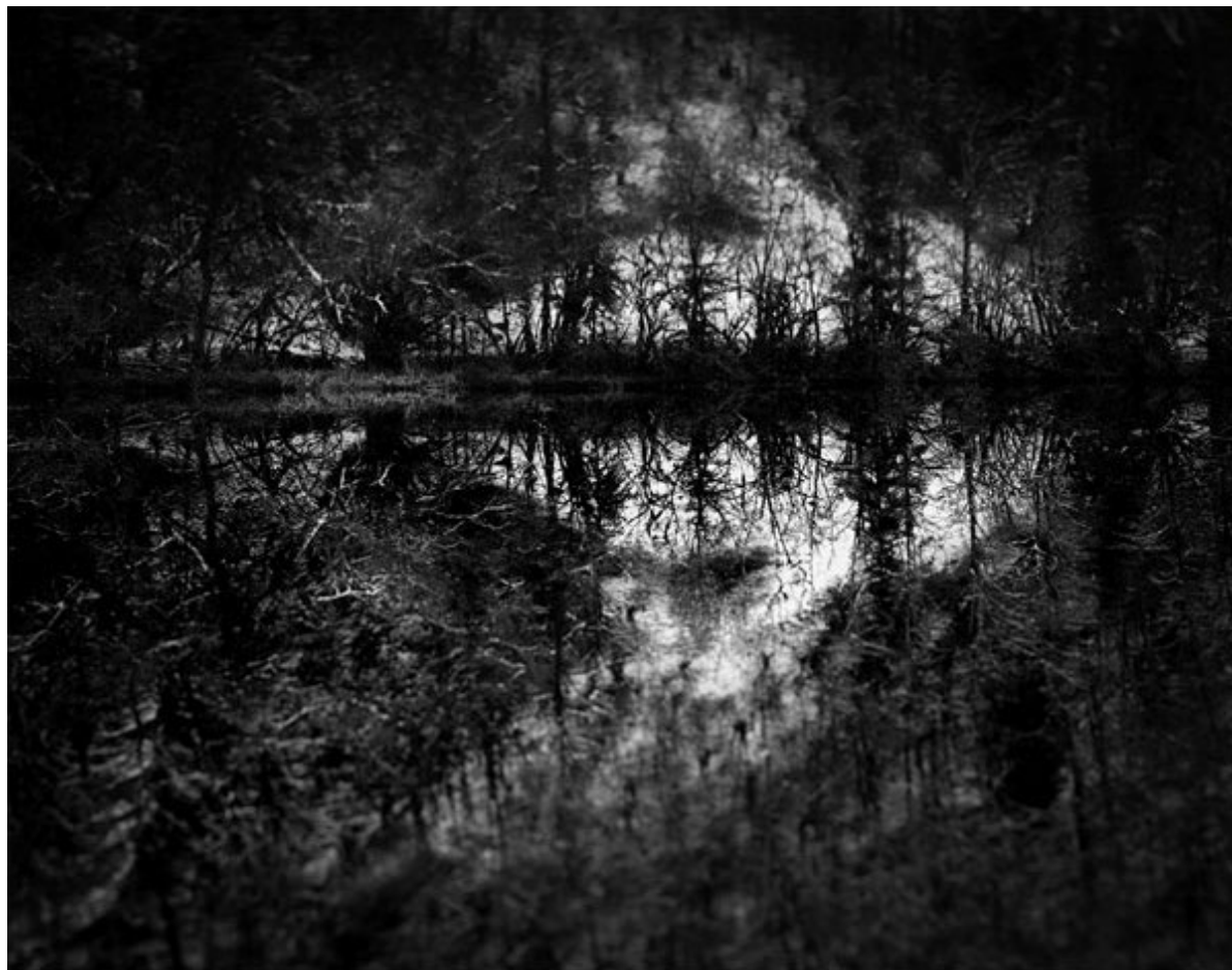
Les Ombres errantes, 2022 © Xavier Voirol

Le service de la culture du canton de Neuchâtel soutient la création dans le domaine des arts visuels notamment par la constitution d'une collection cantonale d'art contemporain. En plus de témoigner un soutien aux artistes neuchâtelois-e-s, le Canton constitue par ce biais un véritable patrimoine qui documente la création artistique du canton. Certaines des œuvres de la collection sont exposées dans les locaux de l'administration. Chaque mois, une œuvre de la collection cantonale vous est présentée par son artiste.