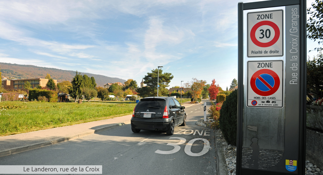
Le Landeron, rue de la Croix