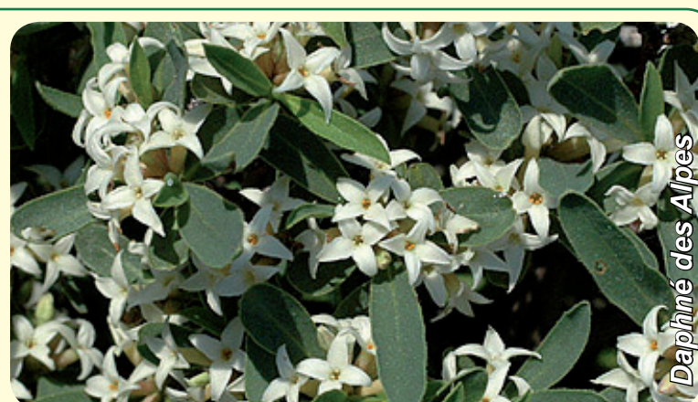
Daphné des Alpes

Quant aux milieux maigres et aux prairies rocailleuses, elles abritent plusieurs espèces rares telles que le lézard vivipare, l'orchis globuleux et le daphné des Alpes.