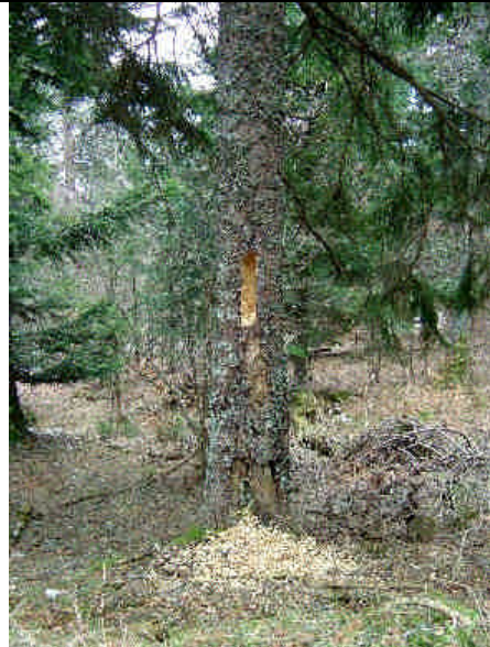
Travail extraordinaire d'un pic à la recherche de nourriture