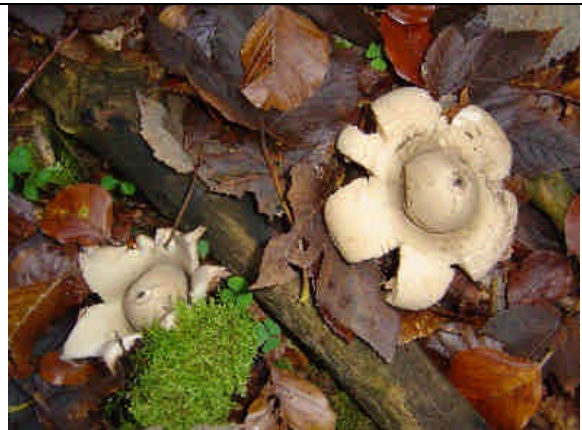
Les champignons jouent un rôle important dans les écosystèmes forestiers