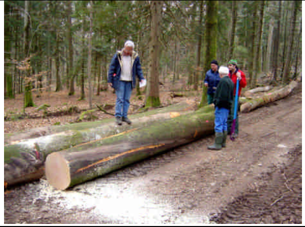
Superbe tronc de hêtre et grande satisfaction pour le propriétaire forestier, le forestier-bûcheron et le scieur