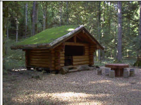
Cabane forestière, valeur inestimable pour de nombreux amis de la forêt