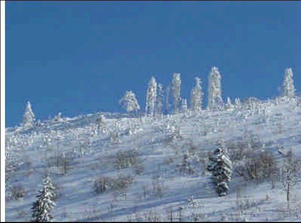
Protection de la Crête du Mont d'Amin