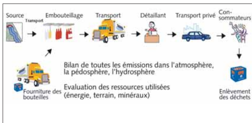
De la source au verre: le cycle de vie de l'eau minérale

réseau, du point de vente au domicile/installations domestiques, réfrigération et gazéification à domicile. Par hypothèse, on admet que l'utilisation d'un récipient à boire et l'évacuation des eaux usées sont équivalentes pour l'eau potable et l'eau minérale. Ces processus n'ont donc pas été retenus dans l'analyse.