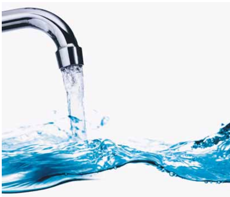
L'eau potable suisse: un brillant écobilan!

Comparer l'eau potable à l'eau minérale n'est pas une idée nouvelle mais, jusqu'ici, rares ont été les études permettant une comparaison directe entre eau potable et eau minérale grâce à la prise en compte de tous les facteurs d'impact primaires et secondaires (production, emballage, transport, distribution, consommation). L'étude demandée par la SSIGE à ESU-services vise précisément à combler cette lacune.