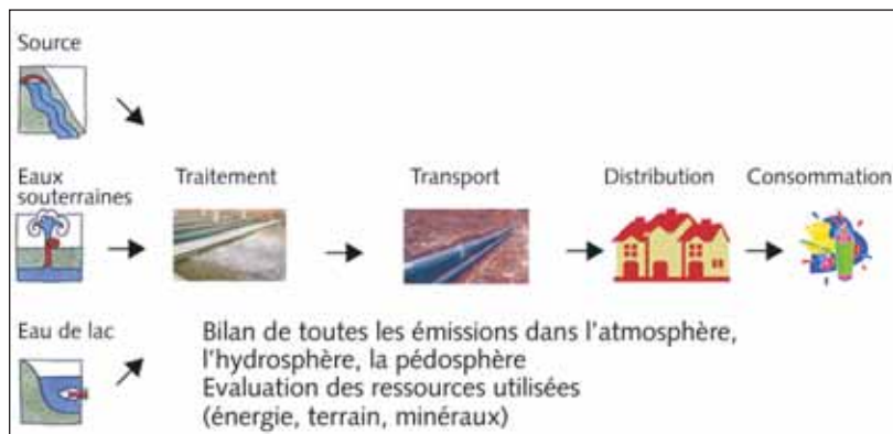
De la source au verre: le cycle de vie de l'eau potable

Selon les auteurs de l'étude, il vaudrait mieux boire l'eau potable que l'eau minérale du point de vue écologique.