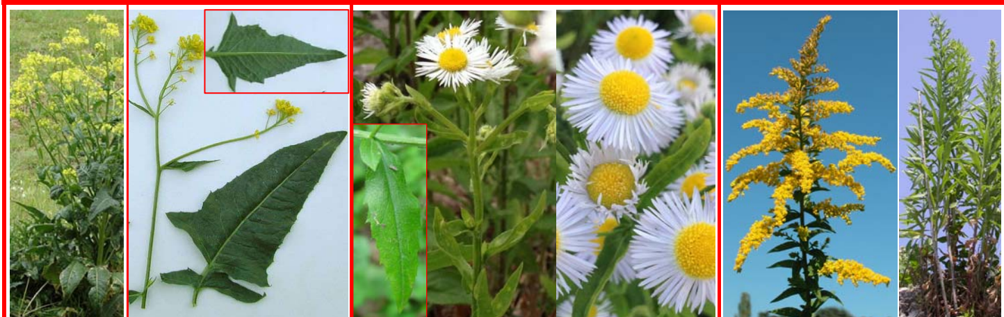
Bunias (ou roquette) d'Orient Bunias orientalis