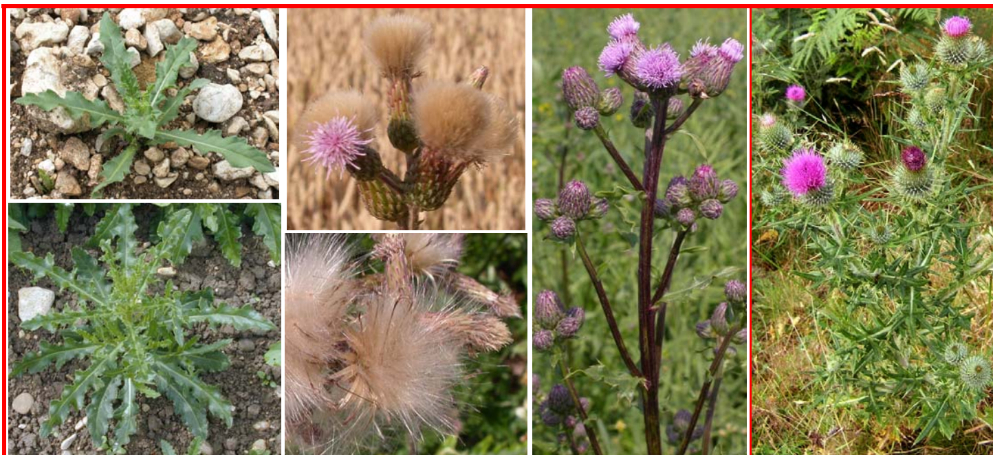
Cirse ou "chardon" des champs (vivace) | Cirsium arvense Ne pas confondre le cirse des champs et le cirse vulgaire avec d'autres "chardons" utiles !

Chaque citoyen est responsable | Seule une lutte en commun aura du succès !