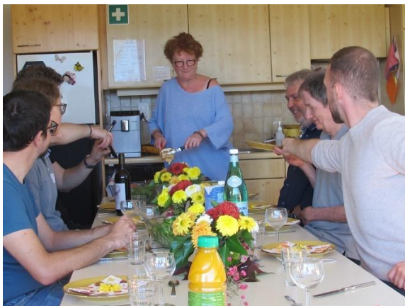
Formule à la carte, qui après une visite guidée peut se terminer par un apéro... Et même un repas si entente....