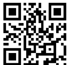
2. QR Code dégustations publiques du PN

Jeudi 17 novembre – 17h – 20h à Hall'itude Market à La Chaux-de-Fonds