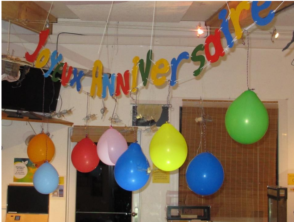
Quelques anniversaires ont été organisés pour des enfants et pour des adultes.

Sur un plan social, Espace Abeilles a été très actif cette fin de saison. En plus des animations, les visiteurs en visite libre ont été très nombreux et de provenance parfois éloignée. Attirés par les dinosaures, ils ont souvent glissé vers Espace Abeilles pour observer de bien plus petites créatures.