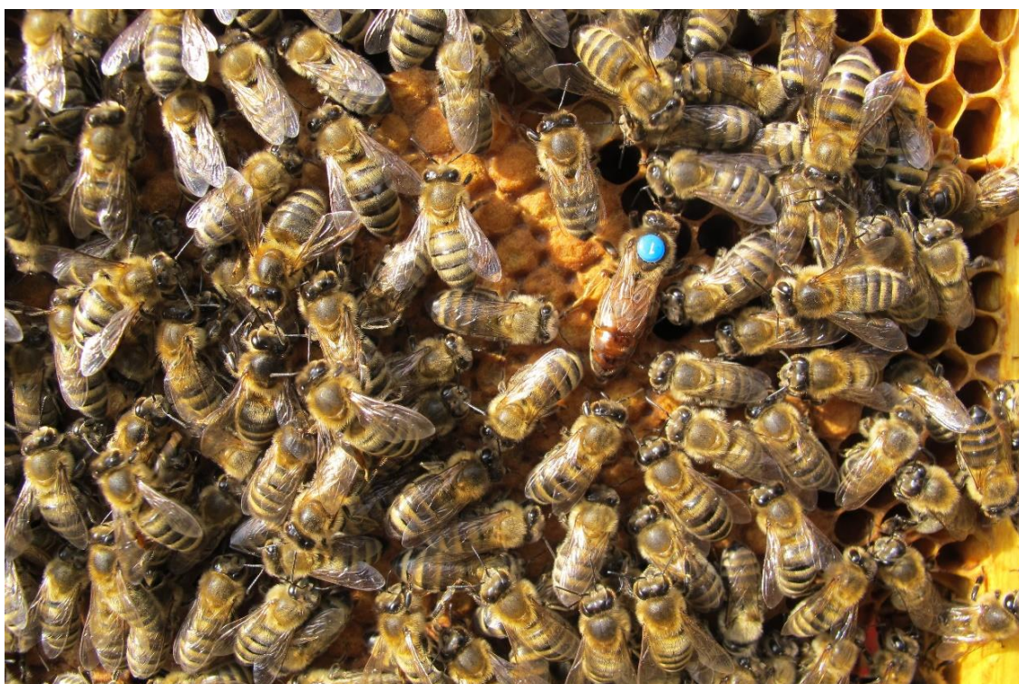
Couvain bien couvert par les ouvrières pour le tenir au chaud.

Dans les colonies qui ont survécu (nous en avons déjà perdu quelques-unes), les ouvrières depuis un mois environ s'alimentent des réserves de l'année passée pour pouvoir générer de la chaleur. 37 degrés, c'est la température qui règne au cœur de la grappe d'abeilles pour que la reine puisse recommencer de pondre, afin d'assurer la relève de leurs consœurs ayant hiverné. Elle commence tout petit, le couvain a la grosseur de la paume d'une main, puis la surface s'agrandit. Si la reine s'emballe, les ouvrières s'occupent de la régulation des naissances en mangeant les œufs en surplus.