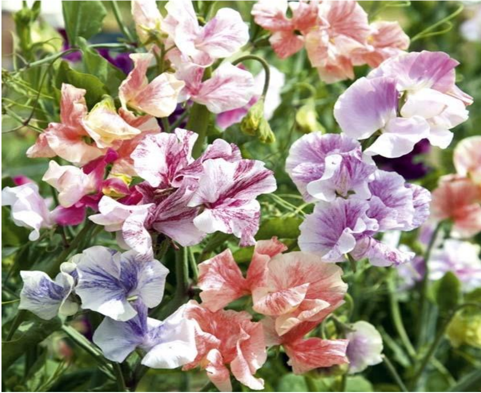
Plantations de plantes retombantes pour le plan d'eau, pois de senteur pastel