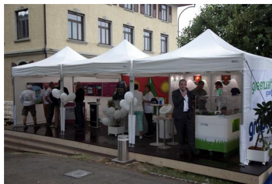
Stand de la commune de Val-de-Ruz

Le stand d'information de La Commune de Val-de-Ruz a permis à ses concitoyens de connaître les prestations informatiques ainsi que les projets d'énergies renouvelables avec leurs partenaires. Malgré une édition mitigée, les différents acteurs se sont dits satisfaits de ce week-end. Aucun incident n'est venu troubler cette rencontre annuelle entre ville et campagne.