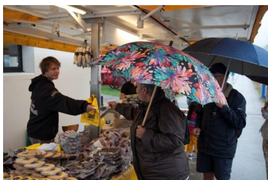
Samedi 24, à Fête la Terre

Après deux mois d'été largement satisfaisants, la météo capricieuse du week-end de Fête la Terre a tout de même attiré les foules à Cernier. La pluvieuse journée de samedi a retardé l'arrivée des visiteurs sur les marchés. Par contre, les belles éclaircies de la matinée du dimanche ont permis aux spectateurs d'admirer la parade et les stands du site dans de meilleures conditions. A l'occasion de son 125 e anniversaire, la Chambre Neuchâteloise d'Agriculture et de Viticulture a renoué avec la tradition. Préparation du sol, fenaison et moisson, tels étaient les tableaux présentés.