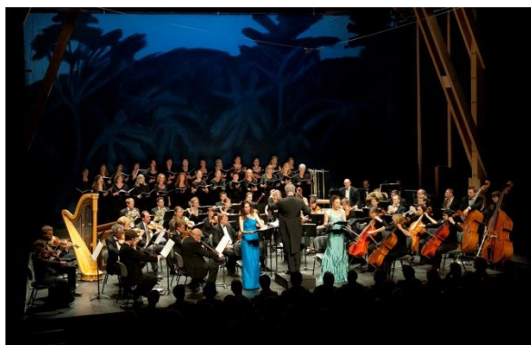
Songe d'une nuit d'été de Mendelsohn

Du 6 août au 1 er septembre, Evologia, point de départ de nombreuses manifestations a été investie par 250 artistes, techniciens et organisateurs pour offrir au public une palette de spectacles musicaux. Les découvertes au Parc Chasseral sous le titres de Bal(l)ades, dans le canton de Berne et en France voisine ont drainé un public ravi qui a sillonné ces territoires irrigués de musiques.