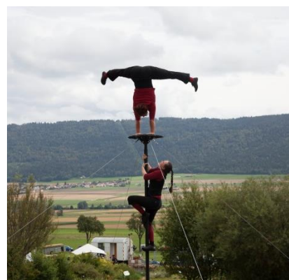
Les Mat Dam's

Concernant les animations, les spectacles de cirque ont permis au public de découvrir de jeunes artistes talentueux, sous le chapiteau de Ton sur Ton comme à divers endroits du site. Les concerts et les ateliers pour enfants des Jardins Musicaux ont tous affiché complet.