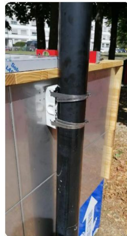
Fixation sur poteau