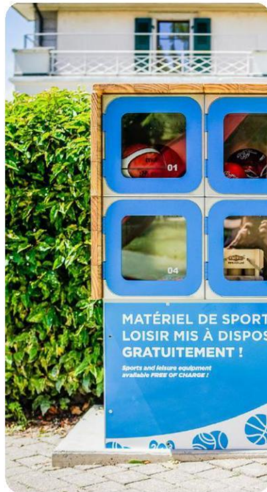
Surface en béton réalisée par vous-même