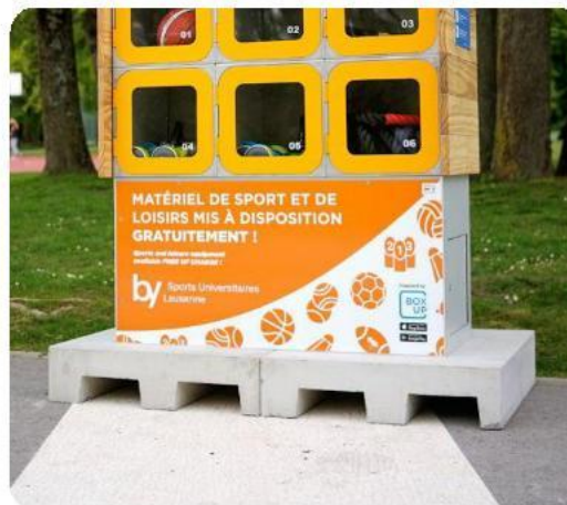
Dalle en béton déplaçable (option)