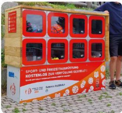
Fixation sur surface existante