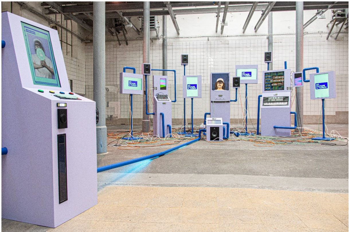
Machine à tubes

L'Association des amis flous porte depuis 2020 les projets de My name is Fuzzy , menés par Bastien Bron. Le projet développe des formes hybrides entre arts visuels contemporains, performance et musique, notamment des installations qui ont circulé en Suisse et à l'international. Après cinq années d'activité marquées par un fort essor, l'association se trouve dans une phase charnière : l'augmentation des invitations, la diversité des formats et les perspectives internationales exigent un renforcement des capacités internes.