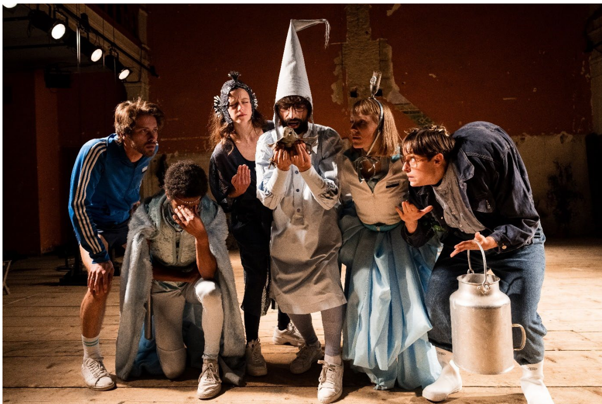
Compagnie de L'Impolie

Fondée en 2018 à La Chaux-de-Fonds, la Compagnie de L'Impolie porte les créations théâtrales de Juliette Vernerey, avec un ancrage croissant dans les réseaux professionnels. Elle prépare aujourd'hui une nouvelle création, Déluge , tout en poursuivant la tournée d' À l'affût et de ses productions précédentes.