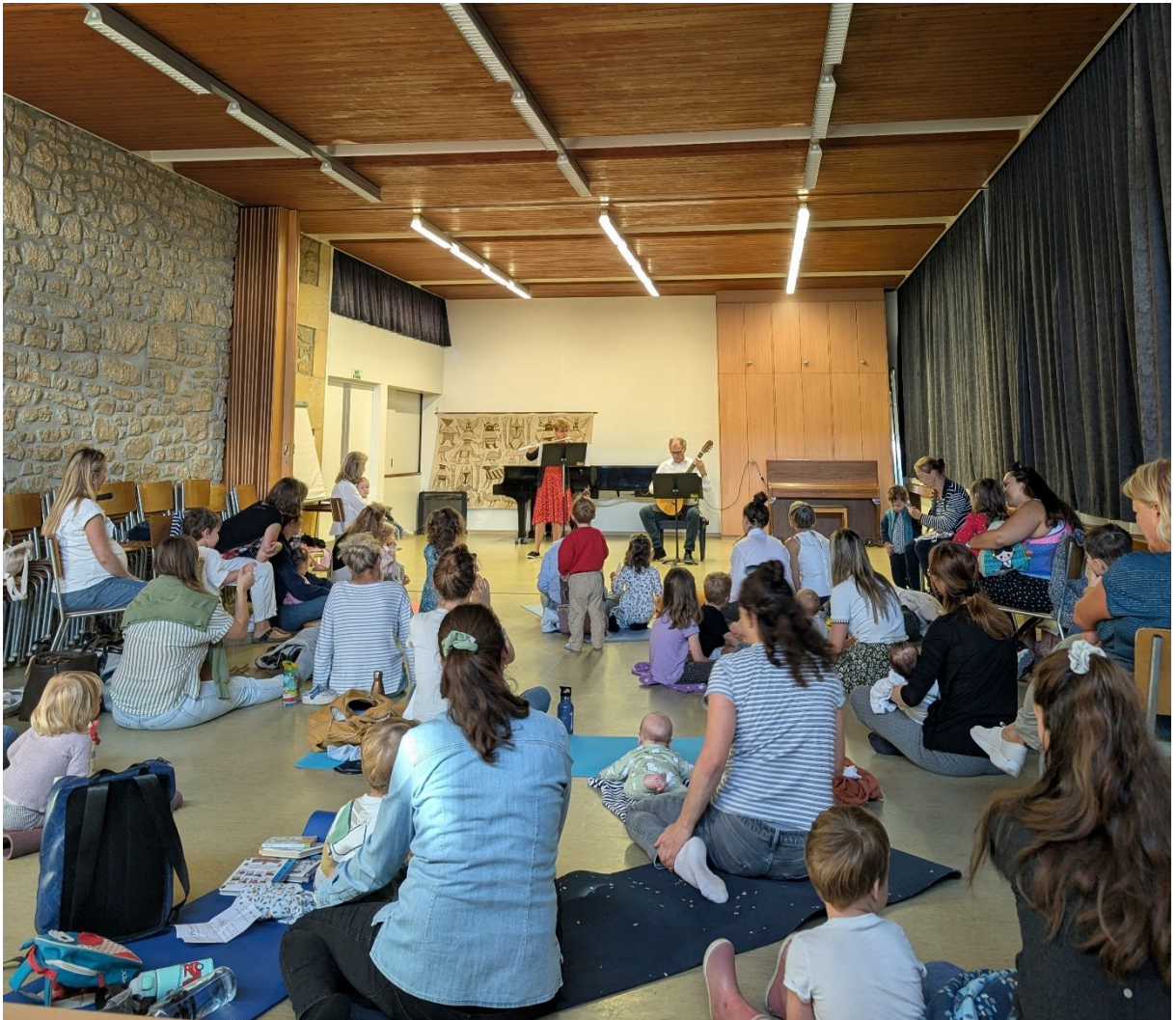
Concert bébé

Fondée en 2022, Les Variations Musicales est une structure active dans la création et la diffusion de concerts de musique classique, avec plus de 100 représentations par an et une croissance rapide du public. Son activité repose sur trois formats : Concerts Bébé , Concerts pour petits et grands et Concerts de chambre , dont la grande majorité est conçue et créée à Neuchâtel, avant d'être largement diffusés en Suisse romande.