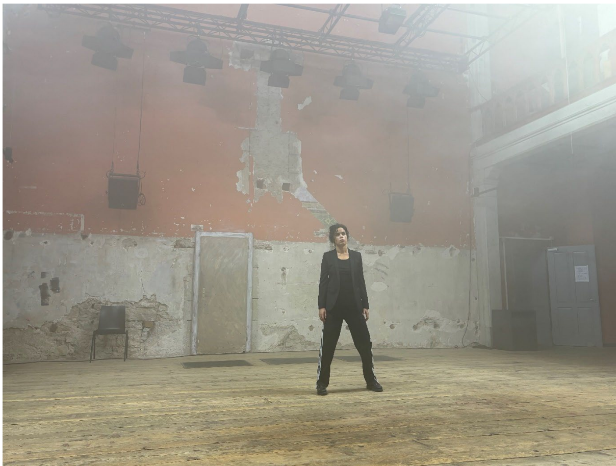
Monologue Feydeau

Fondée en 2017, NTproduction accompagne les créations théâtrales de Nastassja Tanner et collabore régulièrement avec des institutions suisses et françaises. Elle se trouve aujourd'hui dans une étape de structuration, portée par un besoin accru d'organisation interne, de visibilité professionnelle et de diversification des formats de diffusion.