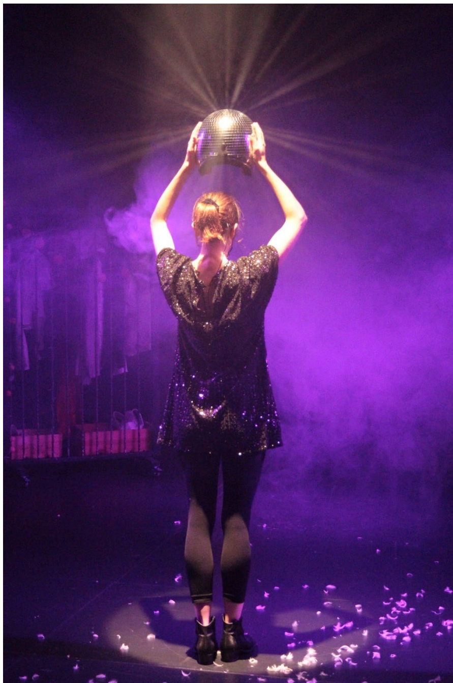
La Compagnie des Autres

Depuis 2021, La Compagnie des Autres développe depuis des créations théâtrales portées par Clémence Mermet. Après une série de projets aux formats resserrés, elle aborde aujourd'hui une phase de montée en ambition, marquée par la préparation d'une future création de grande envergure réunissant dix interprètes.