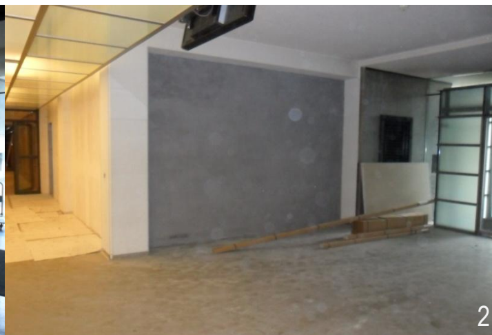
2. Crépissage et peinture des nouvelles cloisons (ext.) 5. Crépissage et peinture des nouvelles cloisons (int.)