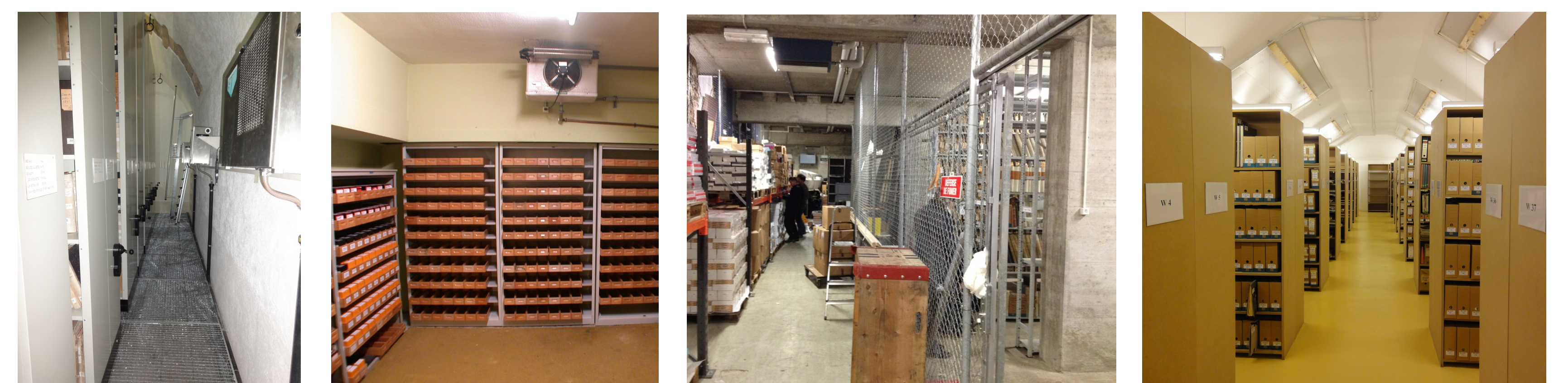
Quatre autres lieux de stockage pour les archives cantonales:

A Neuchâtel dans une cave, dans le safe d'une banque et dans des dépôts partagés avec un musée de la Ville A Couvet sur l'ancien site industriel Dubied