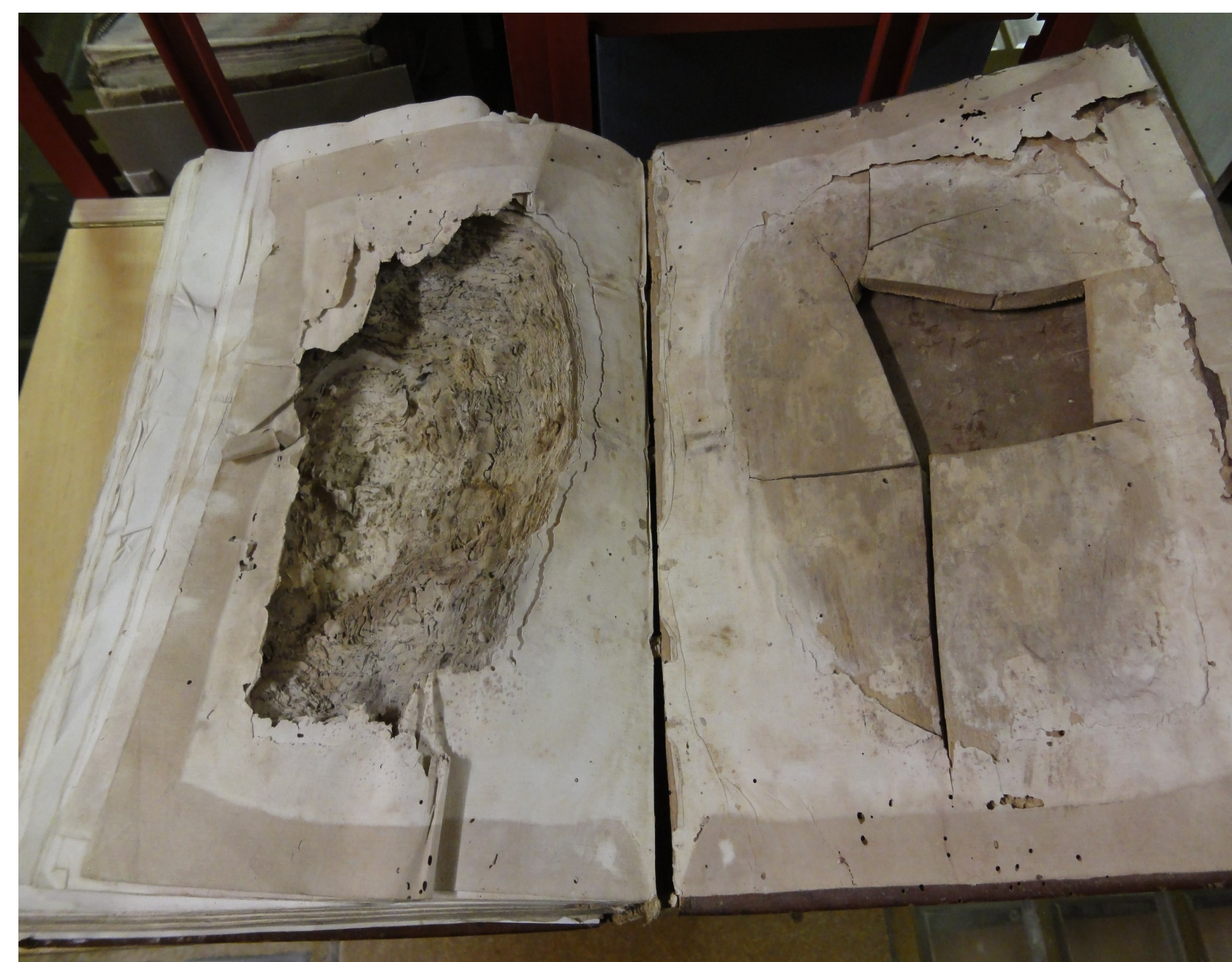
Exemplaire spectaculaire d'un ouvrage endommagé.

A Neuchâtel dans une cave, dans le safe d'une banque et dans des dépôts partagés avec un musée de la Ville A Couvet sur l'ancien site industriel Dubied