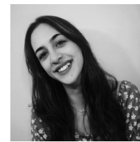
MSc. Maeder-Boulangier Motivation Croyances Familles multilingues