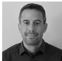
Dr. Conus Relations école-familles Soutien à la parentalité Éducation inclusive