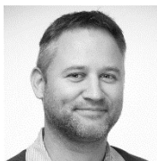
Pr. Berger Stratégies d'apprentissage Motivation et métacognition Enseignants

s'intéresse, dans une approche interdisciplinaire, à tout ce qui touche à l'éducation et à la formation , de la petite enfance à l'âge adulte: comment bien apprendre, bien éduquer, bien former, bien enseigner? Et dans quels cadres? Avec quels moyens?