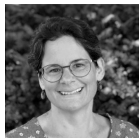
Pr. Ogay Communication interculturelle Relations école-familles