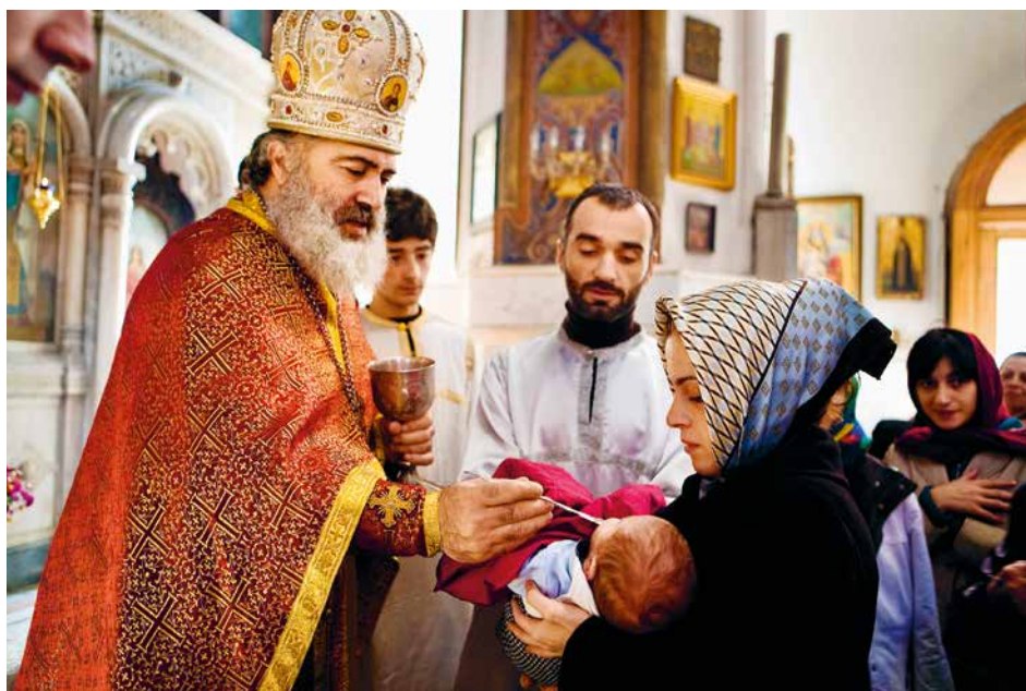
Scène de communion dans une Église orthodoxe de Tbilissi (Géorgie)

Les Églises orientales tiennent à l'unité des sacrements de l'initiation chrétienne : baptême, confirmation et eucharistie. Aussi ces derniers sont-ils tous trois donnés en même temps. Ainsi s'explique cette image d'un jeune enfant recevant la communion.