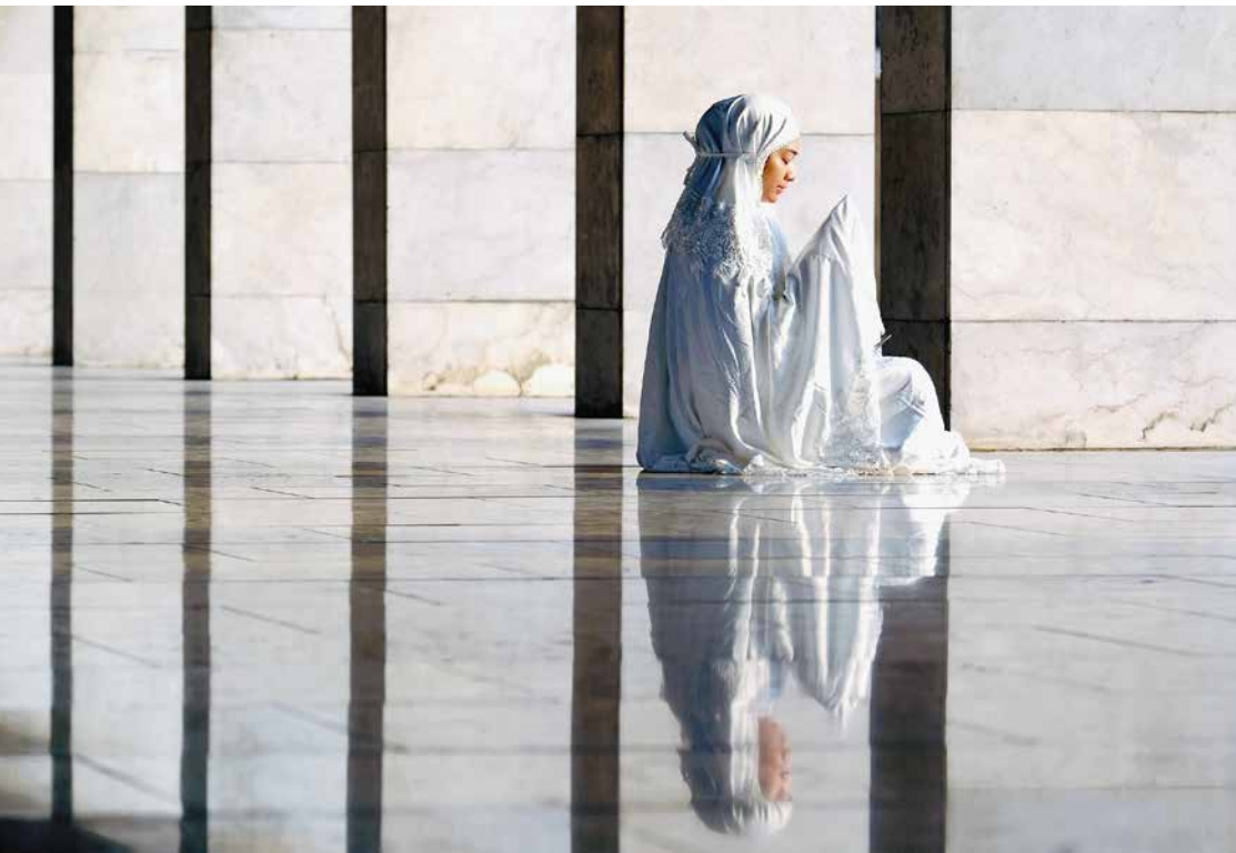
Musulmane en prière à la mosquée Istiqlal de Djakarta (Indonésie) Cette mosquée, la plus imposante de l'Asie du Sud-Est, peut accueillir 120'000 personnes dans son enceinte.

CYCLE 3 : MER 9, 10, 11 OUTILS, DÉMARCHES ET RÉFÉRENCES (ODR)