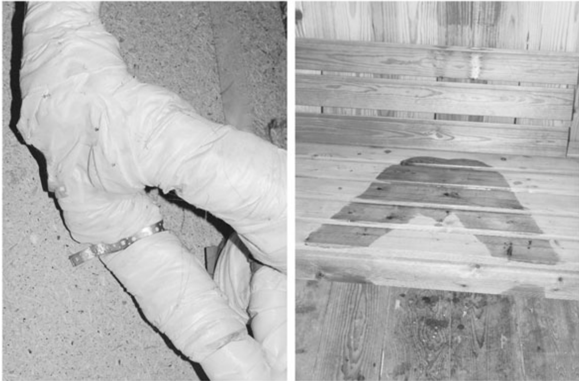
J'attends (série), © Thalles Piaget

Le service de la culture du canton de Neuchâtel soutient la création dans le domaine des arts visuels notamment par la constitution d'une collection cantonale d'art contemporain. En plus de témoigner un soutien aux artistes neuchâtelois-e-s, le Canton constitue par ce biais un véritable patrimoine qui documente la création artistique du canton. Certaines des œuvres de la collection sont exposées dans les locaux de l'administration. Chaque mois, une œuvre de la collection cantonale vous est présentée.