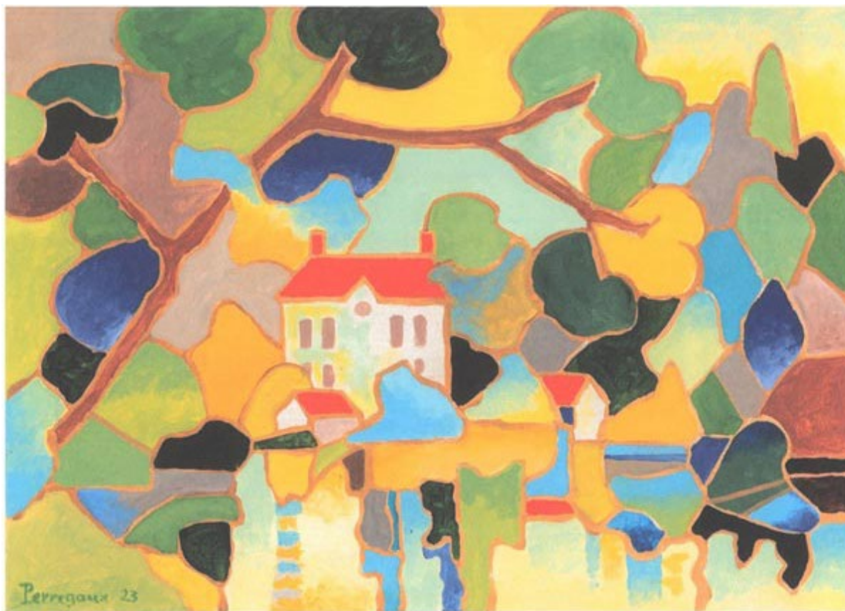
Bords de l'Areuse, Aloys Perregaux

Le service de la culture du canton de Neuchâtel soutient la création dans le domaine des arts visuels notamment par la constitution d'une collection cantonale d'art contemporain. En plus de témoigner un soutien aux artistes neuchâtelois-e-s, le Canton constitue par ce biais un véritable patrimoine qui documente la création artistique du canton. Certaines des œuvres de la collection sont exposées dans les locaux de l'administration. Chaque mois, une œuvre de la collection cantonale vous est