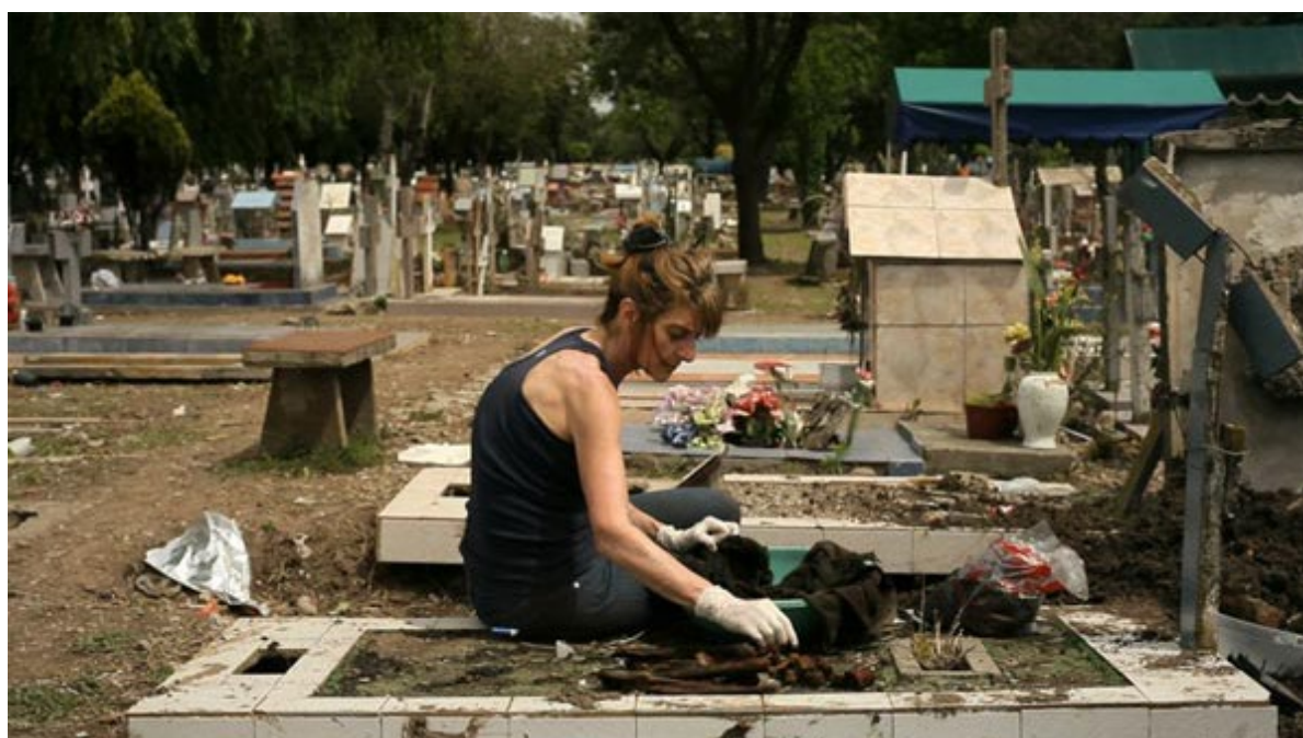
La memoria de los huesos, un documentaire de Facundo Beraudi