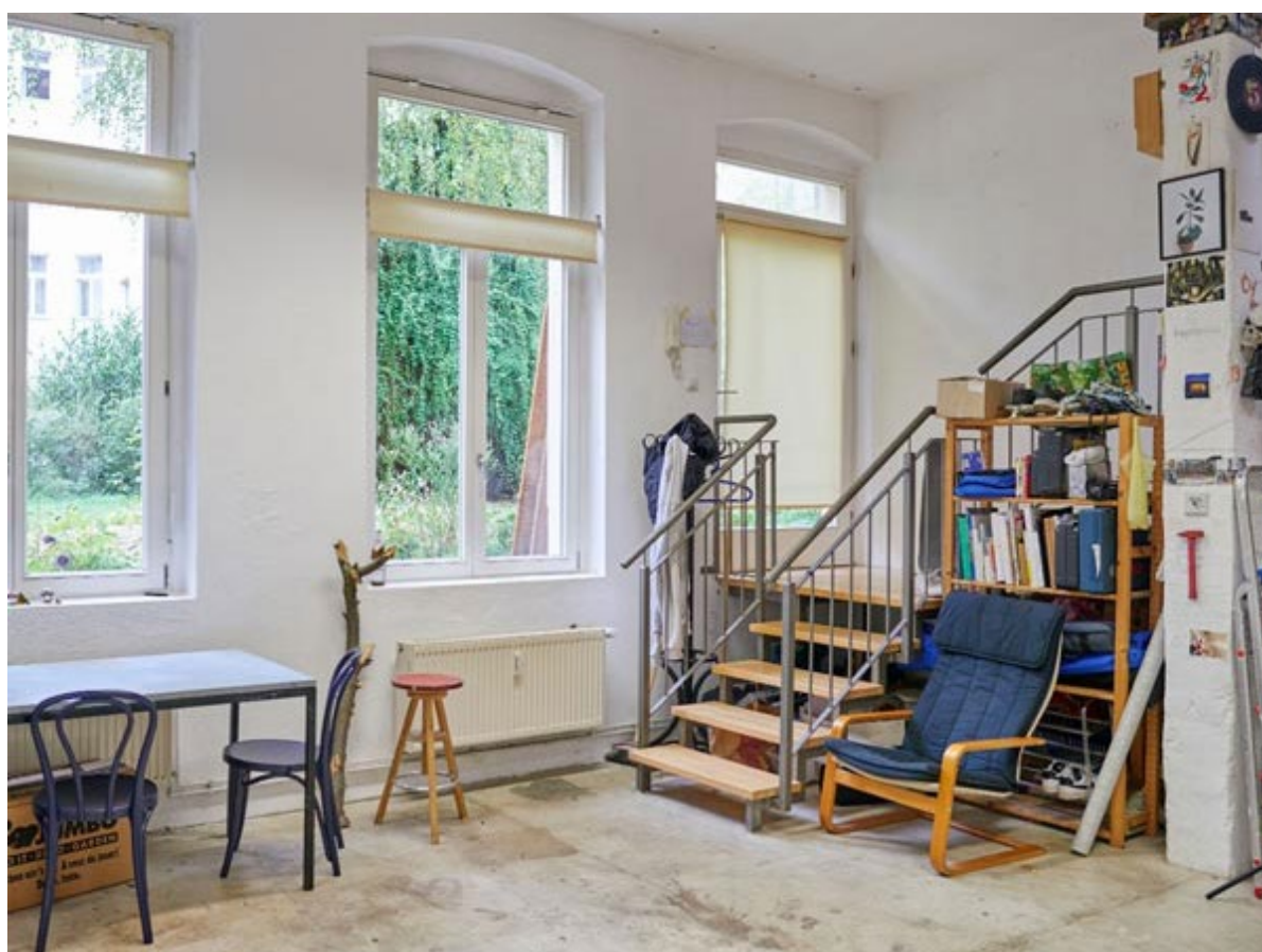
Aperçu de l'atelier de Berlin

Dès le 1 er juillet 2025, un atelier-appartement à Berlin sera mis à la disposition des artistes neuchâtelois et neuchâteloises pour trois séjours successifs d'une durée de six mois chacun. Ce lieu de résidence comprend deux étages : il permet de travailler au rez-de-chaussée et de vivre au premier. Chaque résident ou résidente bénéficie de la mise à disposition des locaux, d'une bourse de 6'000 francs et d'un montant de 2'000 francs pour les déplacements. Ces séjours au sein d'une ville reconnue internationalement pour son dynamisme culturel favorisent les échanges artistiques et la créativité.