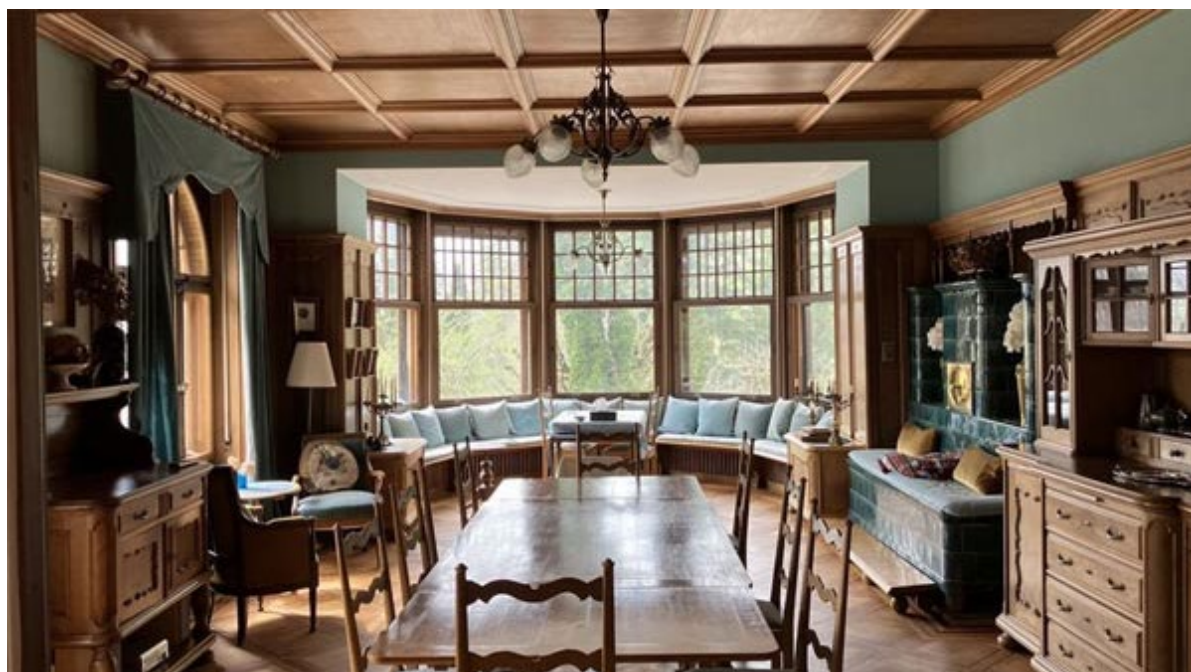
Villa Perrenoud

Dans une société très connectée, l'édition 2024 des Journées européennes du patrimoine, les 7 et 8 septembre 2024, souhaite offrir au public l'occasion de s'interroger sur les interactions et les échanges qui contribuent à façonner le patrimoine tant bâti qu'immatériel. Ce thème peut revêtir des formes très concrètes lorsqu'il s'agit de voies fluviales ou de câbles électriques, mais il peut également être abordé de façon plus abstraite, si l'on songe aux multiples emprunts et réinterprétations d'éléments décoratifs, architecturaux et techniques.