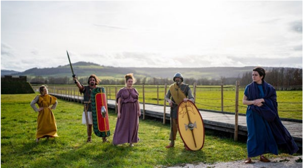
Fashion week, © Sébastien Pitoizet

Le Village celtique au Laténium est un espace d'animations qui invite les enfants et les adultes à expérimenter des gestes du passé. Pour fêter la troisième édition de cet événement qui se tiendra dans le parc du musée du 7 juillet au 10 août 2024, le Laténium propose d'inaugurer cet espace créatif et archéologique par une journée festive le dimanche 7 juillet dès 11h.