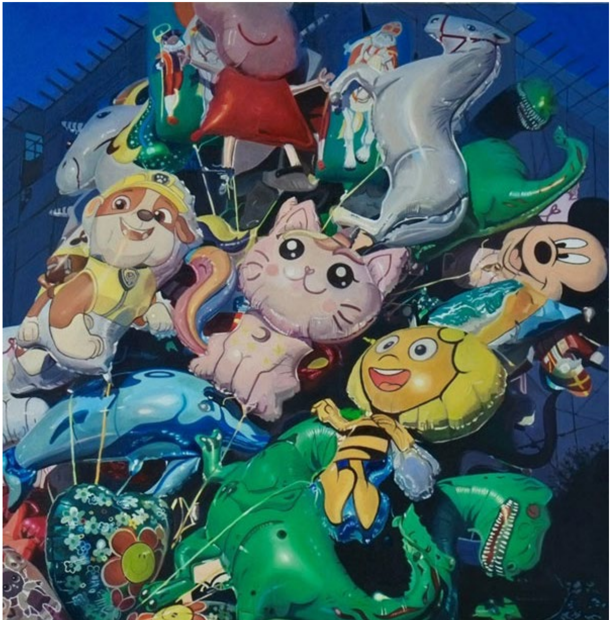
Le vol des chimères © Dominique Delefortrie

Le service de la culture du canton de Neuchâtel soutient la création dans le domaine des arts visuels notamment par la constitution d'une collection cantonale d'art contemporain. En plus de témoigner un soutien aux artistes neuchâtelois-e-s, le Canton constitue par ce biais un véritable patrimoine qui documente la création artistique du canton. Certaines des œuvres de la collection sont exposées dans les locaux de l'administration. Chaque mois, une œuvre de la collection cantonale vous est présentée.