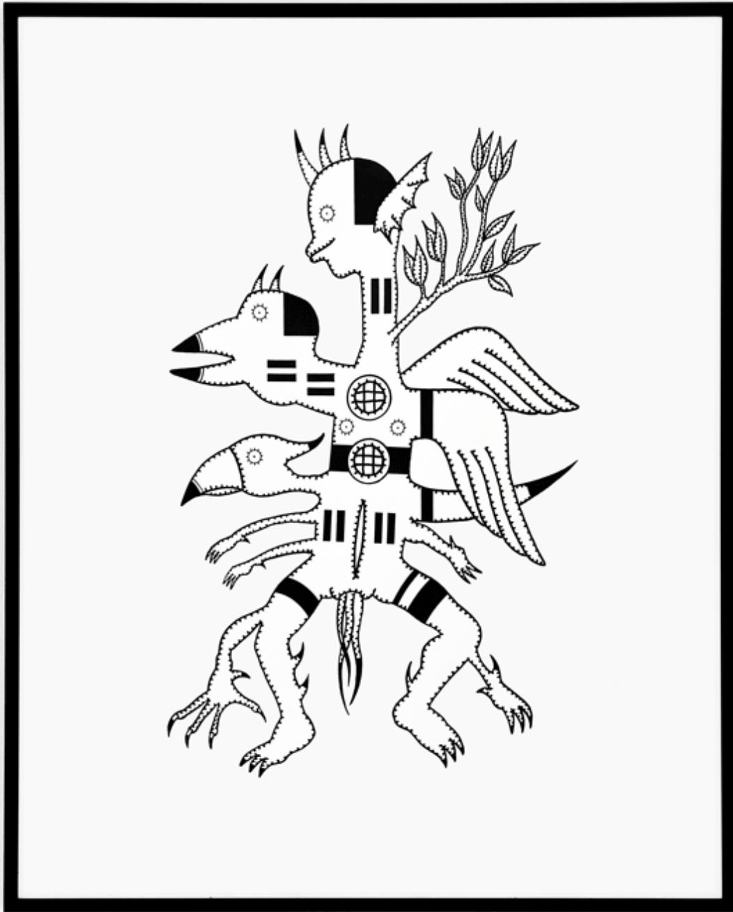
Arcane n° 18, 2023 © Massimiliano Baldassari

Le service de la culture du canton de Neuchâtel soutient la création dans le domaine des arts visuels notamment par la constitution d'une collection cantonale d'art contemporain. En plus de témoigner un soutien aux artistes neuchâtelois-e-s, le Canton constitue par ce biais un véritable patrimoine qui documente la création artistique du canton. Certaines des œuvres de la collection sont exposées dans les locaux de l'administration. Chaque mois, une œuvre de la collection cantonale vous est présentée par son artiste.