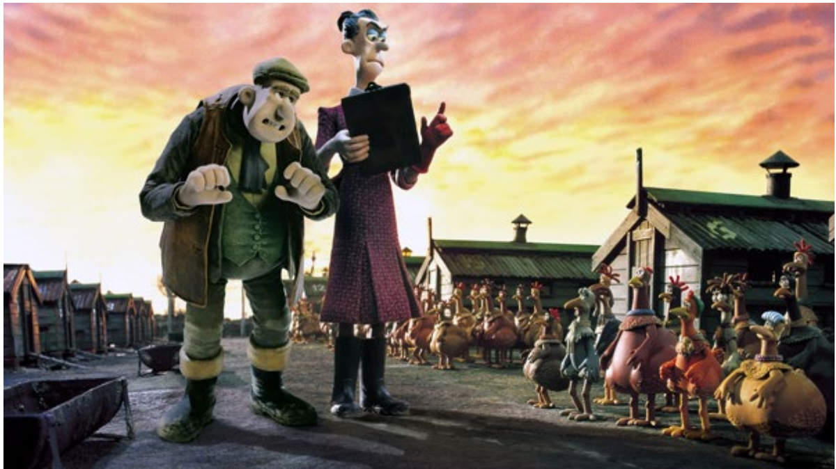
Chicken Run , Nick Park, 2000

Dans le cadre de sa nouvelle exposition Dans les camps. Archéologie de l'enfermement , le Laténium propose un cycle de projections conçu en collaboration avec Cinepel, Passion Cinéma, la Lanterne magique et le Festival du Film et Forum International sur les Droits Humains (FIFDH). Il met en lumière l'inventivité des détenu-es confronté-es à la pénurie et la perte de tout repère et explore le rôle des traces matérielles dans la construction mémorielle.