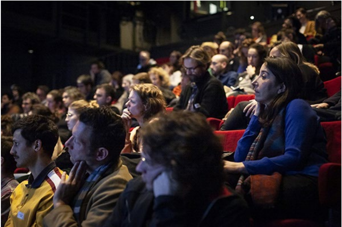
Salons d'artistes 2020

Les Salons d'artistes sont un rendez-vous professionnel annuel organisé par Corodis et la FRAS – Fédération romande des arts de la scène. La prochaine édition aura lieu les 16 et 17 janvier 2023 à Berne, en collaboration avec le Schlachthaus Theater.