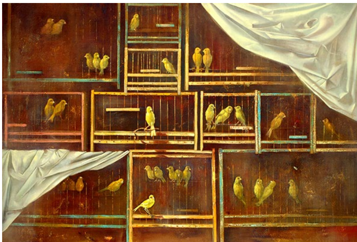
Le Chant des prisonniers , 2014 © Nicola Marcone

Le service de la culture du canton de Neuchâtel soutient la création dans le domaine des arts visuels notamment par la constitution d'une collection cantonale d'art contemporain. En plus de témoigner un soutien aux artistes neuchâtelois-e-s, le Canton constitue par ce biais un véritable patrimoine qui documente la création artistique du canton. Certaines des œuvres de la collection sont exposées dans les locaux de l'administration. Chaque mois, une œuvre de la collection cantonale vous est présentée par son artiste.