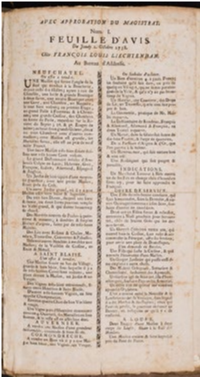
Premier numéro de la Feuille d'Avis de Neuchâtel (5MARVAL-72)

des archives neuchâteloises permet aux chercheurs d'accéder aux fonds conservés aux Archives de l'État de Neuchâtel.