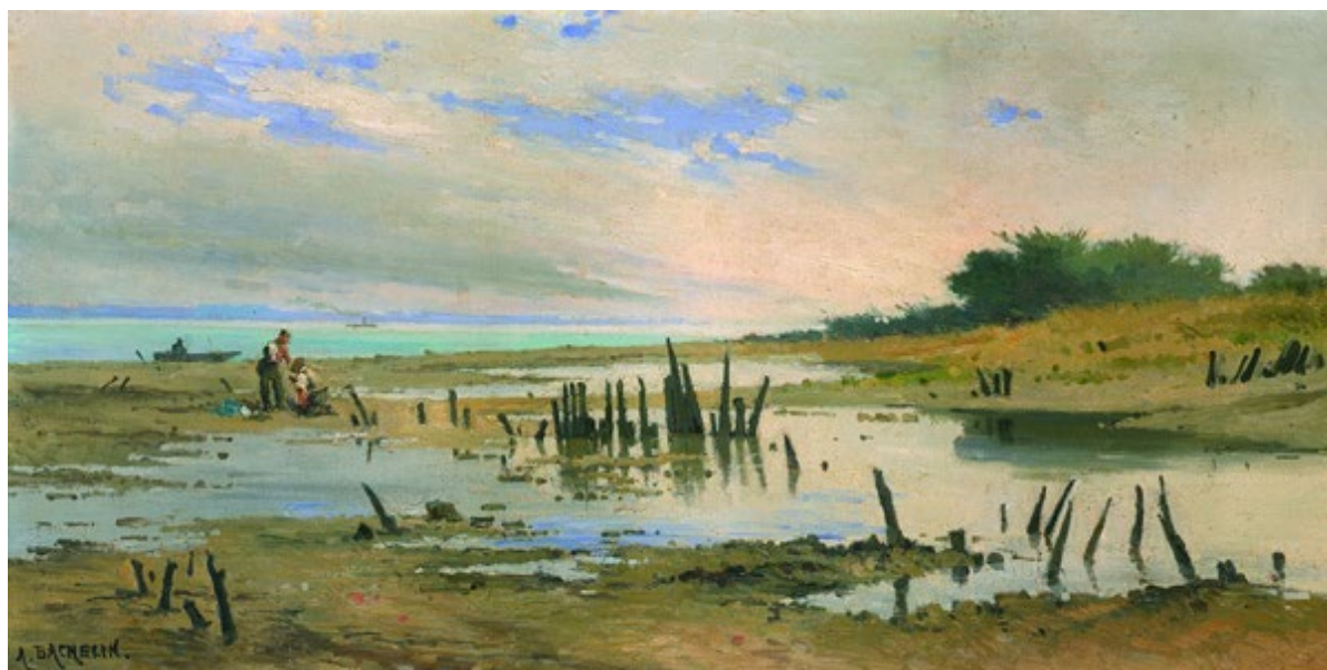
Auguste Bachelin, La Tène. Huile sur toile, 1879. Laténium, exposition permanente

Le site de La Tène sera au cœur de l'attention des équipes du Laténium en 2022. L'exposition temporaire aura pour thème la mise en valeur de l'impact culturel et scientifique des recherches conduites sur ce gisement emblématique de la préhistoire celtique (ouverture le 15 mai).