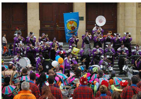
Cortège de la Fête des Vendanges 2007 : guggenmusik et cortège des enfants, les deux photos du site officiel de la Fête des Vendanges