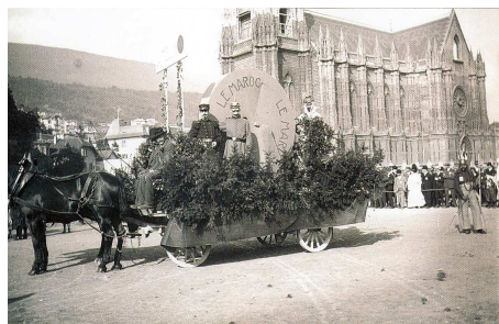
Un des premiers cortèges de la Fête des Vendanges : ici le char du Maroc dans l'édition 1908.

La fête, interrompue par la première guerre mondiale, reprit en 1921 et c'est en 1925 que cette grande manifestation fut organisée avec sa structure actuelle.