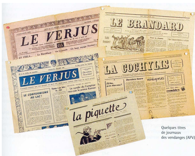
Quelques titres de journaux des vendanges (AFV).