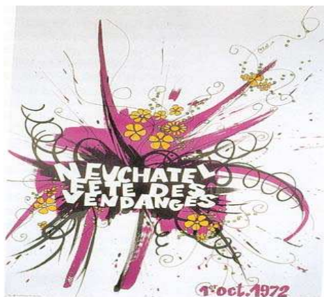
Deux affiches de la Fête : en haut, Jean-Pierre Schüpbach, 1934 (BPUN) en bas, Abel Rejchland, 1972 (AFV), source : La Fête des Vendanges de Neuchâtel, P. Allanfranchini, Editions Fête des Vendanges, 2000.