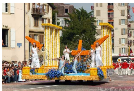
Grand corso fleuri, cortège de la Fête des Vendanges 2005

Chaque année, le dernier week-end du mois de septembre, Neuchâtel prépare sa célèbre Fête des Vendanges ; elle rassemble environ 160 000 personnes. Du divertissement sous toutes ses formes avec : des défilés de Guggenmusik et d' enfants costumés , une parade avec les meilleures formations de fanfares européennes et l'événement majeur de cette fête, le grand cortège et corso fleuri qui se déroule le dimanche. Durant trois jours, stands, guinguettes et groupes de musique animent le cœur de la ville où la fête bat son plein dans la bonne humeur. Le vendredi soir voit les confréries bachiques proclamer l'ouverture de la fête en présence de Miss Fête des Vendanges et de ses dauphines. Le samedi est le grand jour des enfants : leur cortège est d'autant plus touchant qu'ils conçoivent eux-mêmes leurs masques et costumes. Le samedi soir a lieu la grande parade des fanfares, parmi les meilleures formations européennes.