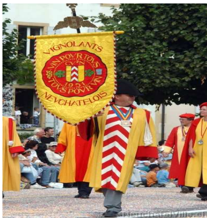
Confrérie bachique, 2005