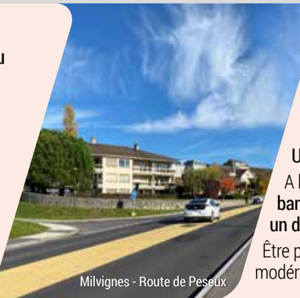
Milvignes - Route de Pesoux

Exemple de cette configuration dans le canton... Couvet – Rue Edouard-Dubied