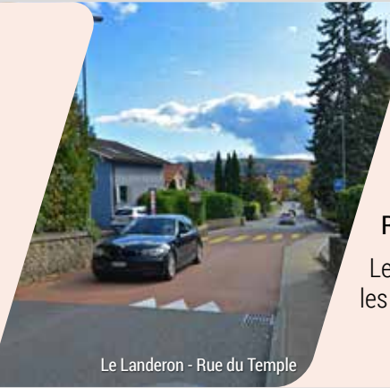
Le Landeron - Rue du Temple

Exemple de cette configuration dans le canton... Boudry – Avenue du Collège