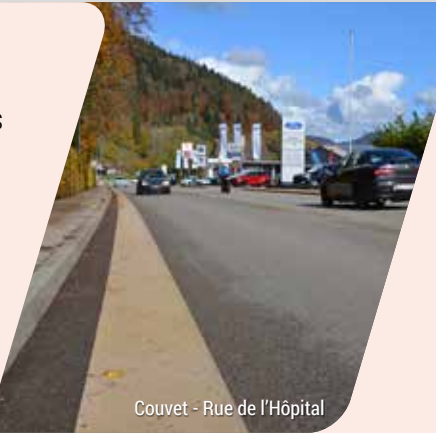
Couvet - Rue de l'Hôpital

Exemple de cette configuration dans le canton... Bôle – Rue du Lac