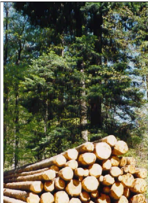
La forêt suisse s'accroît chaque année de 8 mio de m3 de nouveau bois