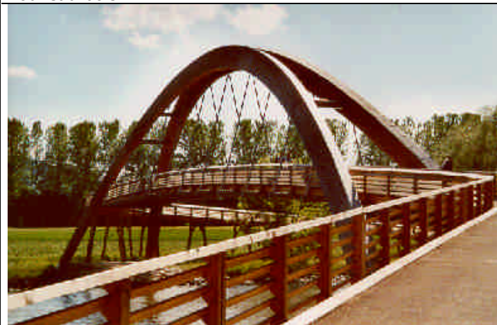
Matériau extraordinaire, le bois peut être mis en valeur dans tous les domaines