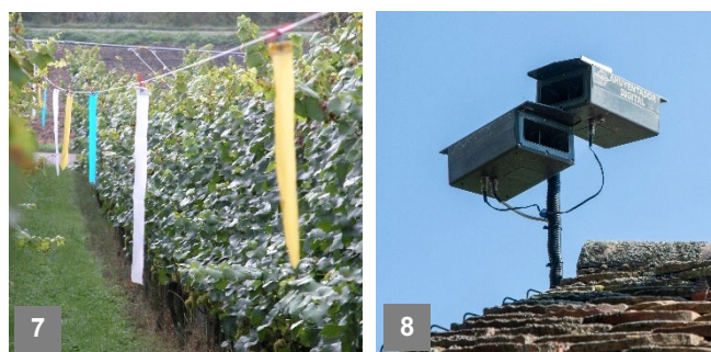
7. Effarouchement optique avec système Bächli

Le garde-vigne est le plus ancien et l'un des meilleurs moyens de lutte contre les oiseaux. Cette méthode est encore utilisée avec succès, principalement dans les grandes régions viticoles. Les garde-vignes, équipés d'armes chargées à blanc, patrouillent régulièrement le vignoble et effarouchent de manière ciblée les oiseaux présents, notamment les étourneaux.