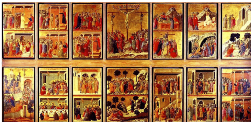
La Maesta , polyptyque peint par Duccio di Buoninsegna, 1308-11