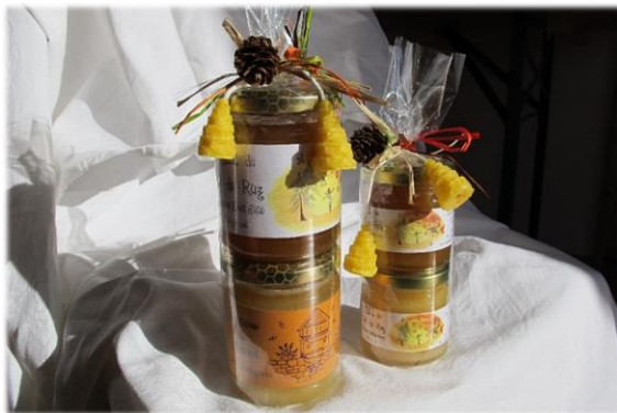
Et de même pour des emballages verticaux.

À disposition dès début décembre, contactez-nous 079 515 38 92