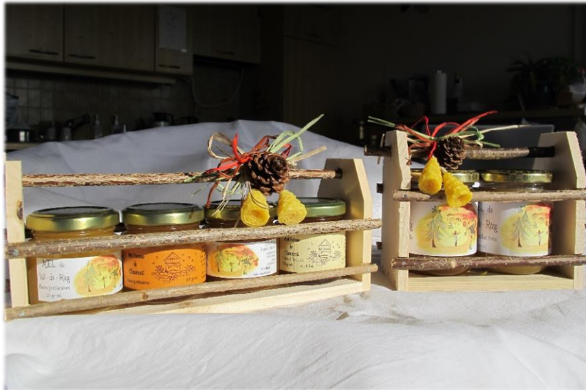
Deux...trois...ou quatre pots dans une cagette en bois...