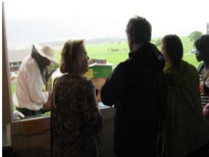
Animation : visite d'une ruche et recherche de la reine.

Durant la fermeture hivernale, la pose d'un nouveau sol en PVC rend l'étage de l'exposition plus agréable. Dans le local annexe, la cuisine/boutique a bénéficié d'un complément de meubles et notre bibliothèque est rangée dans une armoire spacieuse toute neuve.