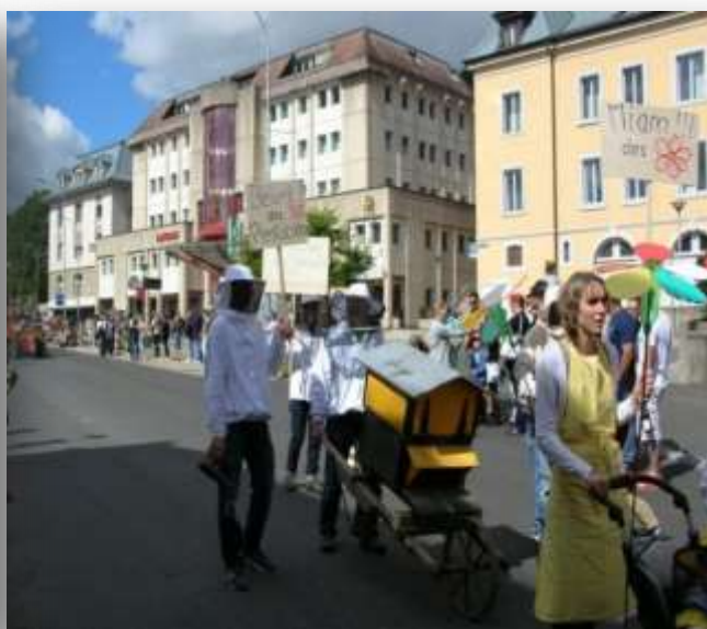
Le groupe Espaces Abeilles lors du cortège du dimanche matin 25 août 2014