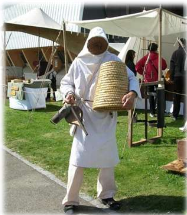
Apiculteur de 1814

L'année 2014 a été marquée par les Fêtes du bicentenaire du canton de Neuchâtel. Deux sites ont accueilli les manifestations, celui d'Evologia organisé par la commune Val-de-Ruz, et le Val-de-Travers. Espace Abeilles a dressé sa cantine à l'est du Mycorama aux côtés des artisans ciriers de Mervelier JU avec notre stand raclette. Succès mitigé des ventes, car l'affluence n'était pas celle attendue malgré un programme proposé riche en événements. Apothéose cependant samedi soir avec le grand feu d'artifice pyromélodique. Les spectateurs présents près du rucher ont pu se réchauffer avec une soupe à la courge préparée au rucher dans l'attente du spectacle.