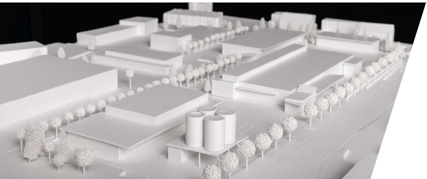
maquette © Julien Dubois Architectes SA

Exposition des projets et résultats du concours