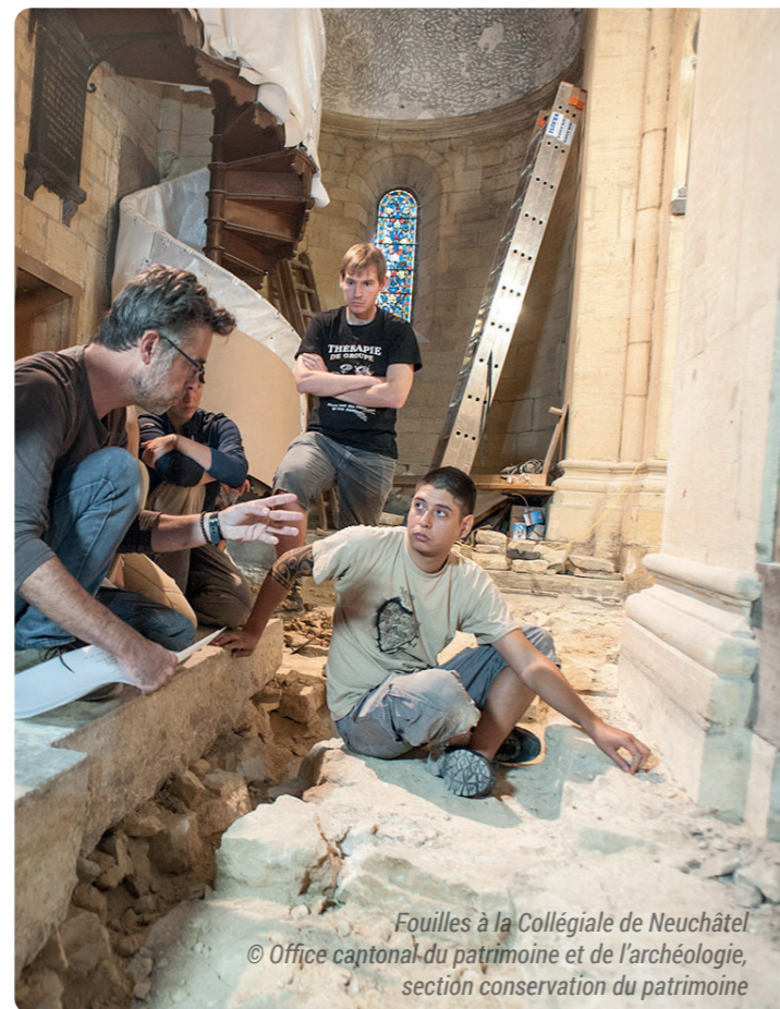
Fouilles à la Collégiale de Neuchâtel

Une fois encore, les collaborations que le Laténium entretient avec ses partenaires privilégiés que sont l'Université de Neuchâtel et l'Office du patrimoine et de l'archéologie se sont avérées très fructueuses, tant dans le domaine de la médiation archéologique, que dans celui de la conservation des collections ou encore de leur étude scientifique. Ces multiples dimensions qui font le quotidien des archéologues – qu'ils ou qu'elles travaillent sur le terrain, dans un laboratoire, dans une bibliothèque ou en contact direct avec les étudiants et le public – viennent s'alimenter mutuellement grâce à la configuration particulière qu'offre le Laténium.