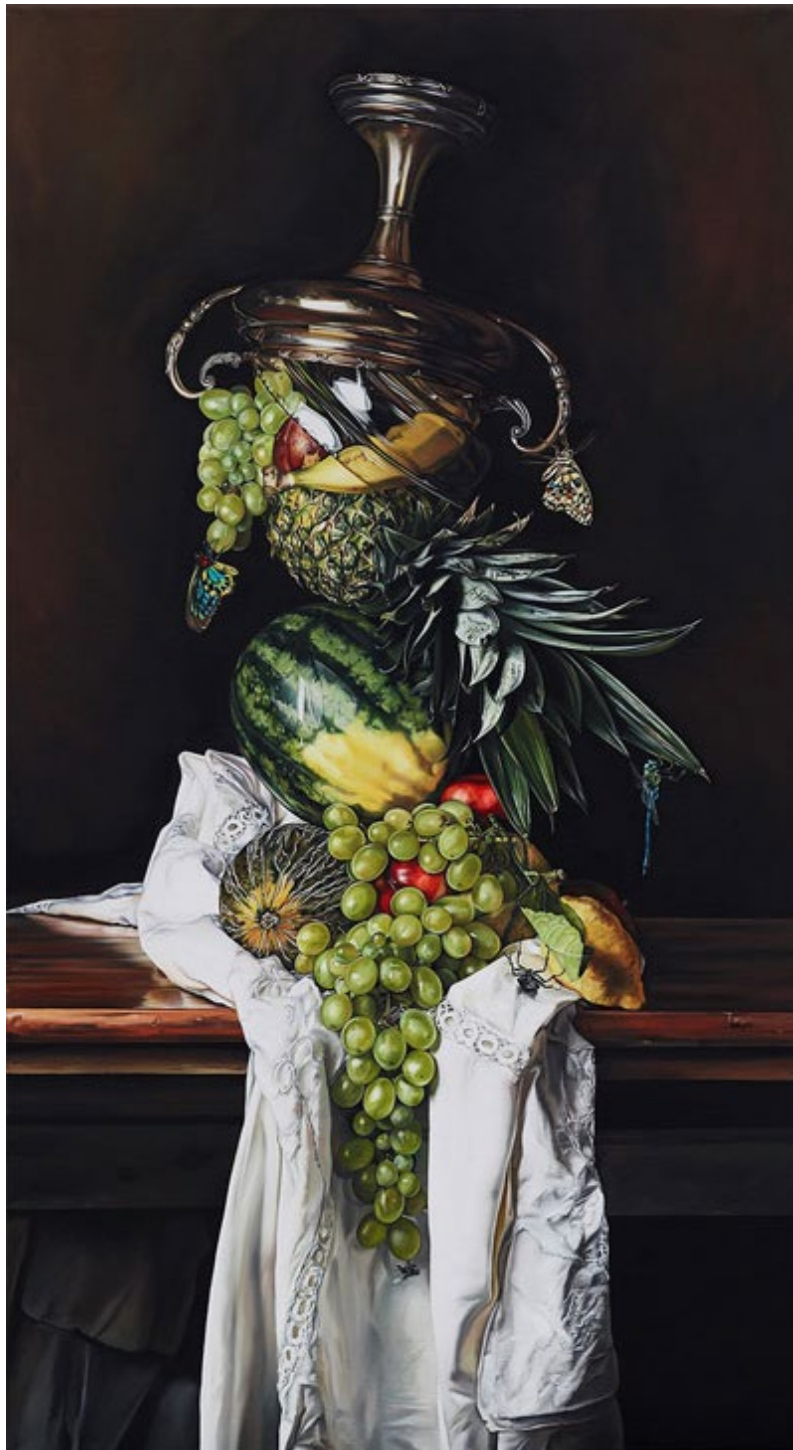
Renverser, 2023 © Till Rabus

Le service de la culture du canton de Neuchâtel soutient la création dans le domaine des arts visuels notamment par la constitution d'une collection cantonale d'art contemporain. En plus de témoigner un soutien aux artistes neuchâtelois-e-s, le Canton constitue par ce biais un véritable patrimoine qui documente la création artistique du canton. Certaines des œuvres de la collection sont exposées dans les locaux de l'administration. Chaque mois, une œuvre de la collection cantonale vous est présentée par son artiste.