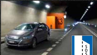
Aires d'arrêt d'urgence