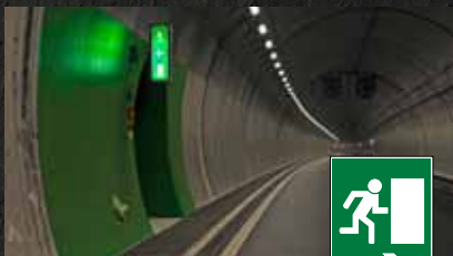
Issues de secours