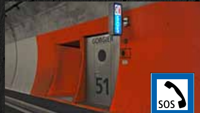
Niches de secours