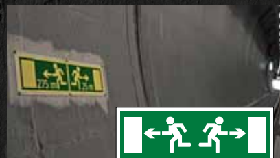
Panneaux indiquant les issues de secours