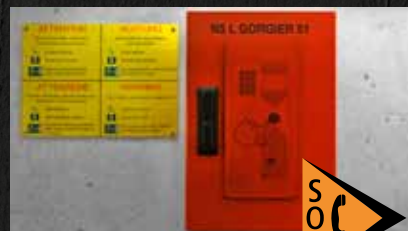
Bornes de secours