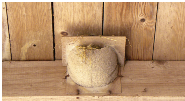
L'interstice laissé entre le toit et le nid a permis aux moineaux de s'installer dans ce nid d'hirondelle de fenêtre.

Rien ne montre que les déjections causent des dégâts persistants sur les façades. Cela dépend probablement de la nature du revêtement de façade. Généralement, un nettoyage à l'eau suffit.