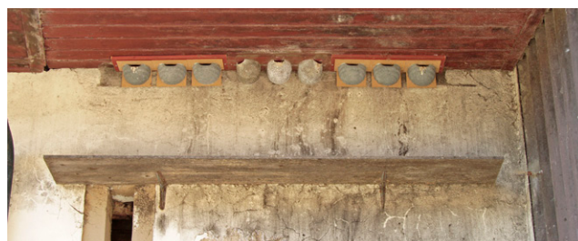
Adéquat – Planchette à fientes sous les nids artificiels.

La deuxième ou troisième nichée est en route.