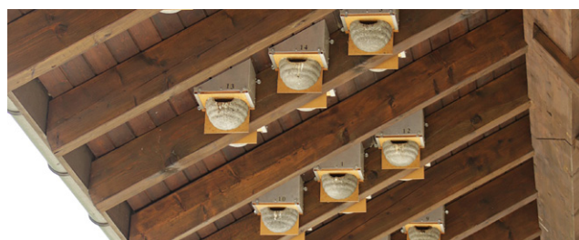
Adéquat – Nids artificiels fixés sur des chevrons et éloignés de la paroi.