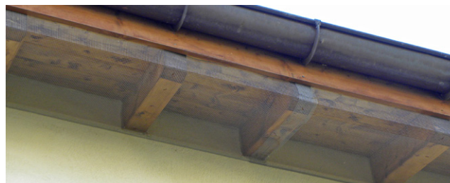
Adéquat – Grillage protégeant la façade aux endroits sensibles.