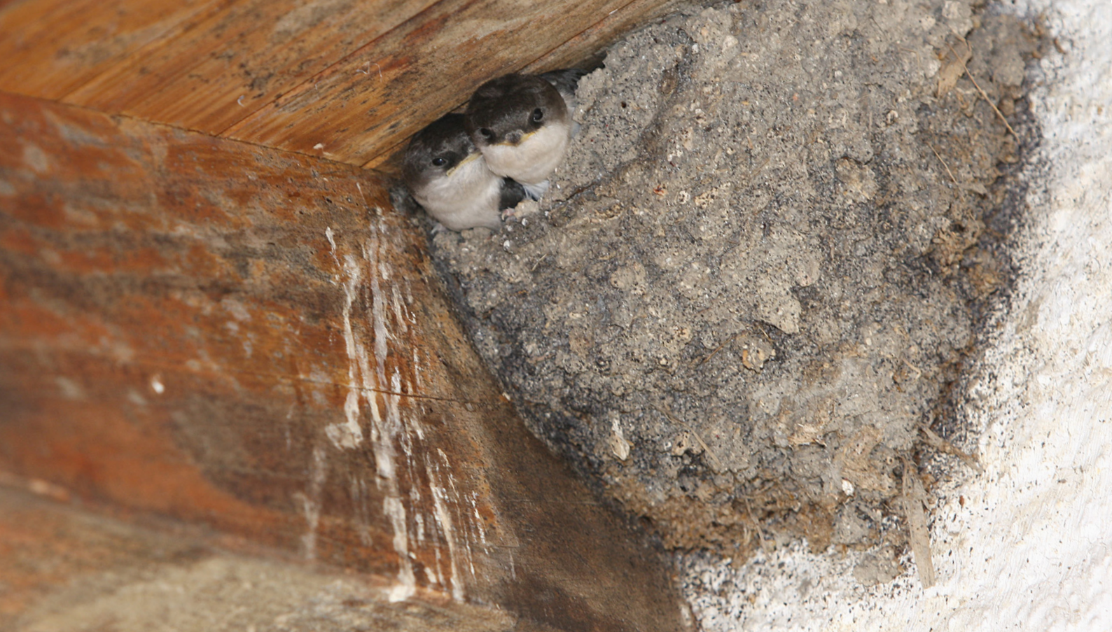
Nid typique d'hirondelle de fenêtre