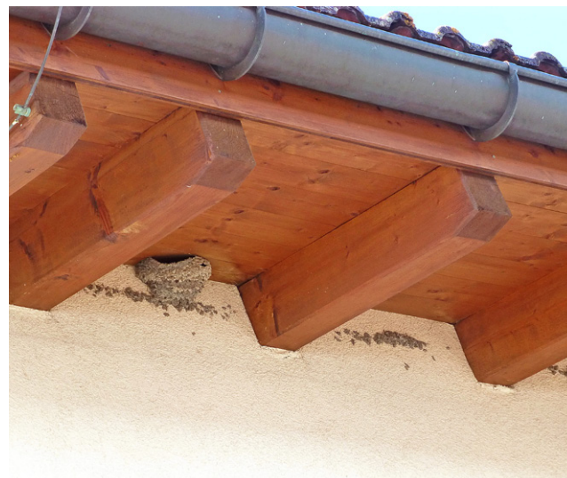
Façade accueillant un nid terminé et des ébauches de nids naturels.