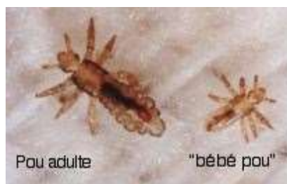
Pou taille réelle