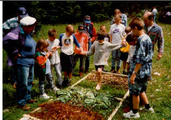
Les jeux des enfants : 1 ère étape du sport en forêt