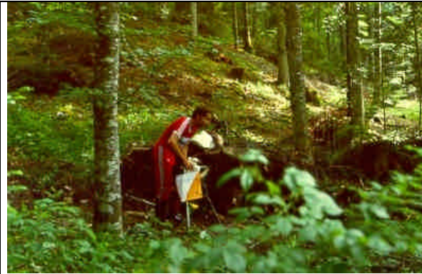
Le coureur d'orientation pratique son sport grâce aux forêts accessibles