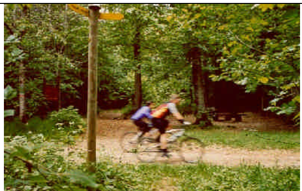
De nombreux parcours VTT se trouvent en forêt