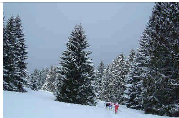
Magnifique course de ski de fonds à travers les pâturages boisés du Jura