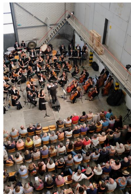
Les couleurs et les parfums de Shéhérazade rendus avec délicatesse dans les Fours à Chaux de Saint-Ursanne.