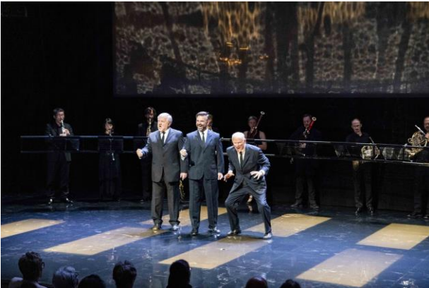
Le Tribun. Le spectacle composé d'œuvres de Mauricio Kagel, Kurt Weill et Bertolt Brecht a passionné et aiguillonné le public de la Grange aux Concerts.

Orchestres, ensembles, artistes, compositeurs, techniciens, bénévoles et direction ont tous permis cette 22 e édition. Merci à eux, aux collaborateurs d'Evologia et aux 13'000 festivaliers qui l'ont suivie. Retour en photos sur quelques temps forts 2019 !