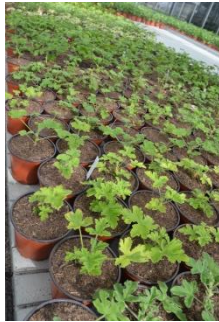
Géraniums rempotés dans leurs pots définitifs

Comme chaque année, les plantes obtenues par bouturage seront vendues sur le site d'Evologia, les 20 et 21 mai 2019, de 9h à 16h. Un stand sera installé devant la porte de l'EMTN et des apprenti-e-s pourront vous renseigner.