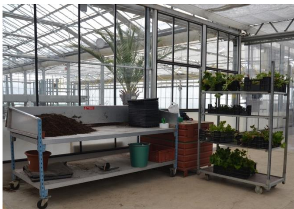
Rameaux de géraniums et table de travail

Lors de la semaine du 14 au 18 janvier 2019, les classes 1 et 2 des horticulteurs paysagistes AFP, épaulées par Mmes E. Baguet-Oppliger et D. de Coulon et les classes de fleuristes, épaulées par M. A. Treuthardt, ont effectué le bouturage de certains géraniums de la collection.