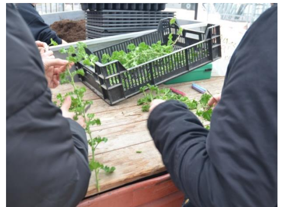
Façonnage des boutures de tête