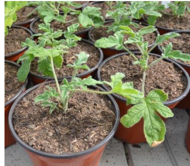
'Rebert Lemon Rose'

Les plantes sont vendues CHF 5.-/pièce. L'argent récolté financera les voyages de fin de formation des apprenti-e-s ayant participé aux travaux de multiplication de la collection.