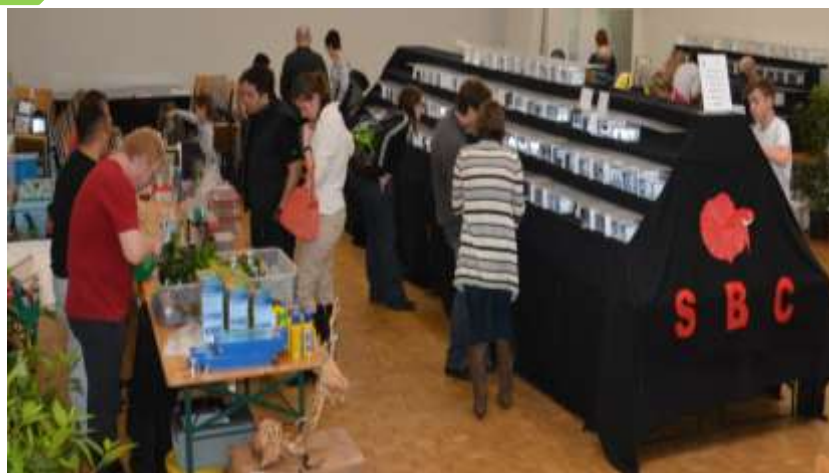
Qu'est qu'un Betta Splenden (source Wikipédia)

Le Combattant ( Betta splendens ) est une espèce de poissons de la famille des Osphronemidae. Il est originaire des eaux douces tropicales du Sud-Est asiatique (Thaïlande, Cambodge, Viêt Nam, Laos et Malaisie). Cette espèce est très couramment élevée en captivité où elle est utilisée pour des combats d'animaux dans leurs pays d'origine, et un peu partout dans le monde comme poisson d'aquarium. Des variétés domestiques existent dans différentes formes et couleurs.