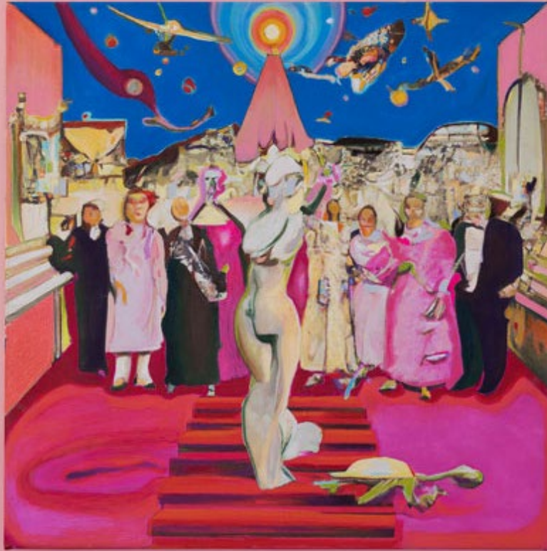
Ghost #6 (Souvenirs d'une étoile déchue et son cortège de morts glorieux aspirant à la célébrité), 2022 © Marie Guta et Lauren Huret

Le service de la culture du canton de Neuchâtel soutient la création dans le domaine des arts visuels notamment par la constitution d'une collection cantonale d'art contemporain. En plus de témoigner un soutien aux artistes neuchâtelois-e-s, le Canton constitue par ce biais un véritable patrimoine qui documente la création artistique du canton. Certaines des œuvres de la collection sont exposées dans les locaux de l'administration. Chaque mois, une œuvre de la collection cantonale vous est présentée par son artiste.