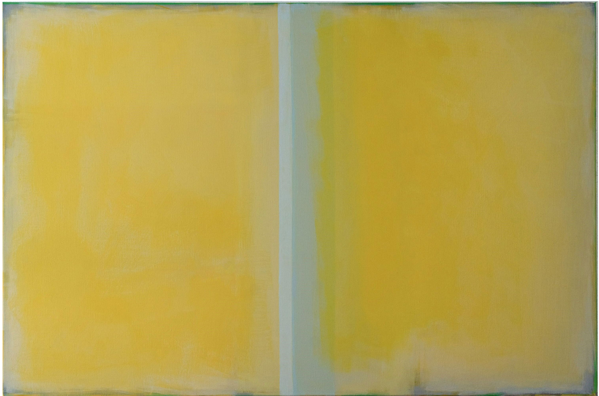
Sans titre, 2020 © colette b

Le service de la culture du canton de Neuchâtel soutient la création dans le domaine des arts visuels notamment par la constitution d'une collection cantonale d'art contemporain. En plus de témoigner un soutien aux artistes neuchâtelois-e-s, le Canton constitue par ce biais un véritable patrimoine qui documente la création artistique du canton. Certaines des œuvres de la collection sont exposées dans les locaux de l'administration. Chaque mois, une œuvre de la collection cantonale vous est présentée par son artiste.